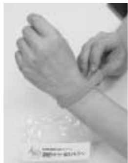
サポーターのしるしとして配られる「オレンジ・リング」

そこで市は、認知症になっても安心して暮らせる地域づくりをめざして、認知症サポーターの養成講座を実施しています。内容など、詳しくは各地域包括支援センター、または高齢者支援課(620・7243、FAX624・7720)までお問い合わせください。