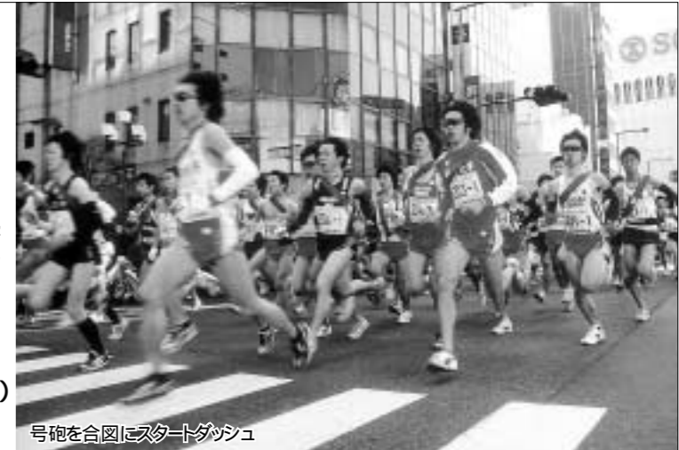
号砲を合図にスタートダッシュ