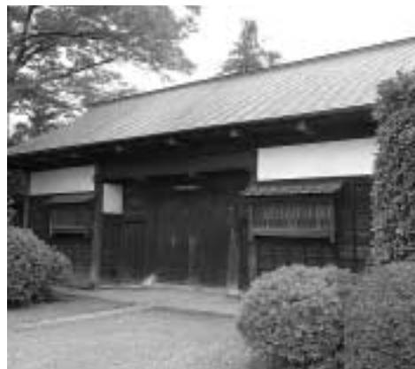
往時の豪華をしのばせる関根家の長屋門

八高線の小宮駅から北西へ。線路に沿って数分歩くと、大きな門が見えてくる。これは江戸時代、栗之須村(あわのすむら。現在の小宮町)の名主を務めた関根家の長屋門である。関根家は江戸時代後半に木材を扱う商人として活躍するなど、裕福であったと思