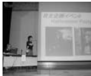
学生ならではのユニークな提案が

まちづくりに学生のアイデアをいかに活用し、学生と市長が意見交換を行うため、学生と市長がふれあいを開催します。