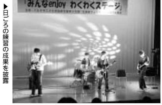
▶日ごろの練習の成果を披露

印のチケットはセットで4,000円です。また、期間中はガスバール・カサド国際チェロ・コンクールのパネル展示やチェロの演奏体験も行います。