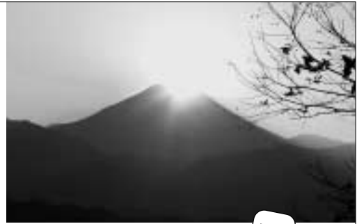
ダイヤモンド富士