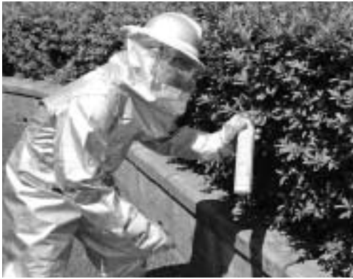
ハチの巣の駆除は防護服の着用で安全に

この時季、ハチの活動が活発になり、軒下や木の枝などに巣づくりをします。お気づきの方は、小さいうちに駆除をしましょう。なお、市は、専門業者(有償)の紹介や、駆除用の防護服の貸し出しを行っています。