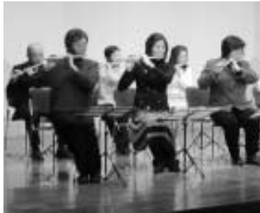
しの笛の音色を響かせて

地域の伝統芸能を体験していただくこと、しの笛の体験講座を開催します。また、来年2月には、八王子車人形・説経節との合同発表会も行います。 対象 小学5年生以上の初心者、同講座の初心者コースを修了された方