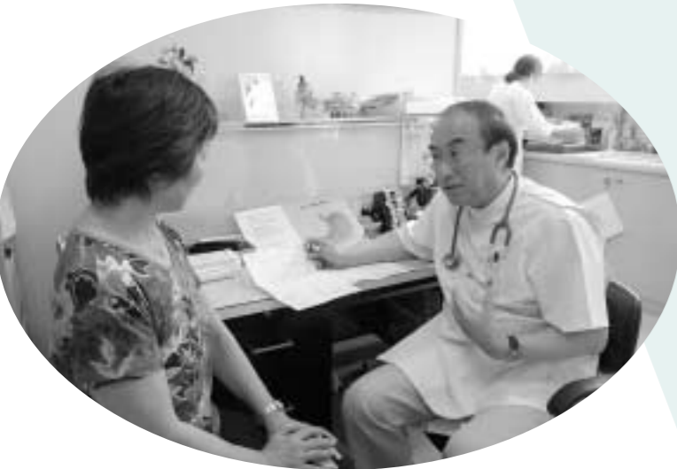
皆さんの健康状態や生活習慣を理解している「かかりつけ医」は、いざという時も強い味方になります。

日時 9月11日(木)午後3時～4時 会場 いちようホール 定員・費用 150名(先着順)・無料 申し込み 不要(直接会場へ) 問い合わせ 八王子消防署 625・0119、FAX625・2856