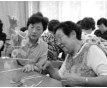
完成した作品を手にとって(大横福祉センターのおりがみ教室で)

月日・年齢・性別・電話番号、利用証番号(お持ちの方)、障害のある方はその内容と等級、返信面のあて名を書いて、9月12日(必着)までに各施設へ。なお現在、各施設のほかの教室を受講されている方は、申し込みができませんのでご注意ください。