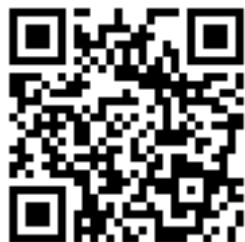
モバイル(携帯電話)版ホームページのQRコード

ホームページアドレスは http://mobile.city.hachioji.tokyo.jp/ です。また、左記のQRコードからもアクセスができますので、携帯電話などに登録して、ぜひご利用ください。