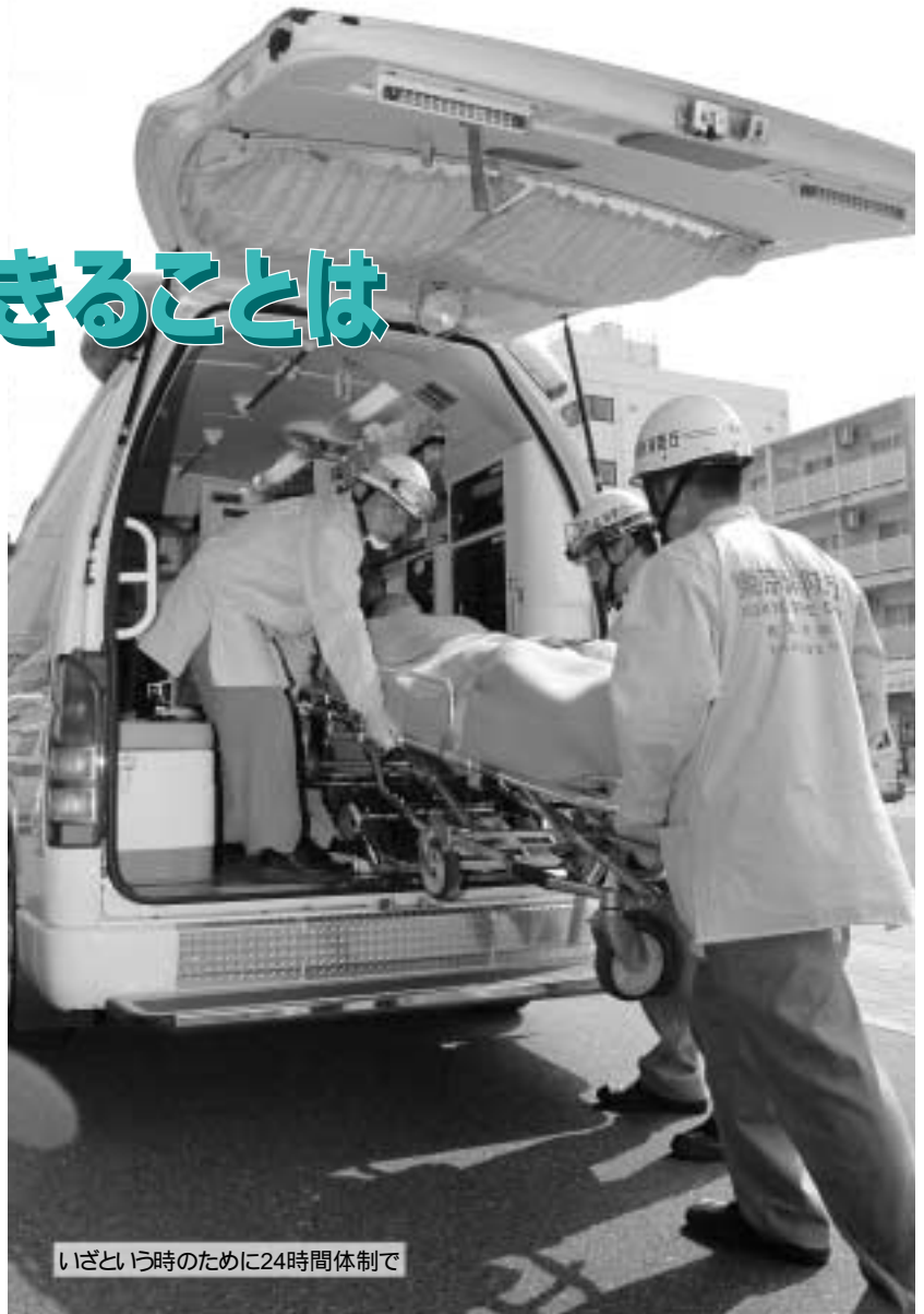
いざという時のために24時間体制で

9月9日は「救急の日」。そこで今号は、救急医療の体制を守るために私たちにできることを考えていきます。