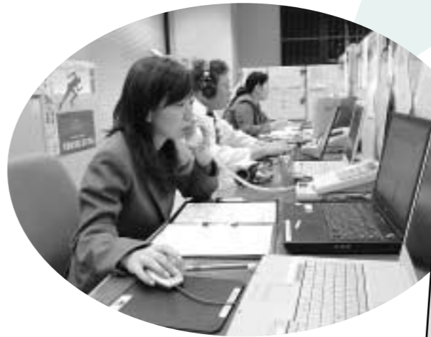
救急相談センターでは、看護師や医師が連携しながら、皆さんからの問い合わせに答えています。