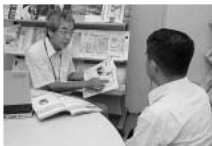
技術開発などの助言を行う相談員も常駐して

市は八王子駅北口に先端技術センター「開発・交流プラザ(旭町102TCビル5階)」を開設しています。ここではものづくりに取り組む企業や大学の研究開発を支援するための場。市と交流し、連携を深める中で、国内最先端の医療機器や環境計測用機器などが開発されています。このほかに、も、交流スペースや40人収用可能な会議室も完備されています。打ち合わせなどにご利用ください。