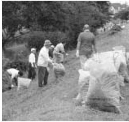
力を合わせてきれいな川に

私たちの身近にある川の環境をより良くするために、毎年開催される「みんなの川の清掃デー」。38回目を迎える今年は、9月7日(日)午前6時から行います。当日は浅川のほか、城山川、大沢川、川口川、湯殿川、兵衛川、山田川、谷地川、大栗川、大田川などの堤防とその周辺を清掃します。 なお雨天の場合は、14日(日)に延期。この日も雨天の場合は、中止となります。問い合わせはごみ減量対策課(620・7256、FAX626・4506)へ。