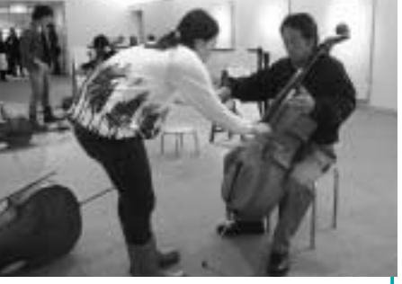
チェロに触れる演奏体験コーナーも ふれあい財団(621・3005、FAX621・3011)までお問い合わせください。

市民の皆さんに身近な所で気軽に音楽に親しんでいただくこと、12月6・7日に、いちょうホールで「八王子音楽祭」を開催します。日程は下表のとおり。チケットの発売日は9月6日です。購入方法・費用など、詳しくは学園都市文化