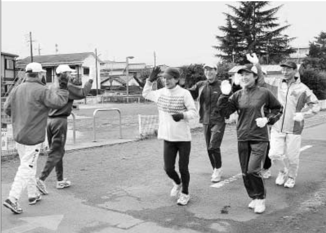
適度な運動の習慣で、生活習慣病知らずの健康な体に