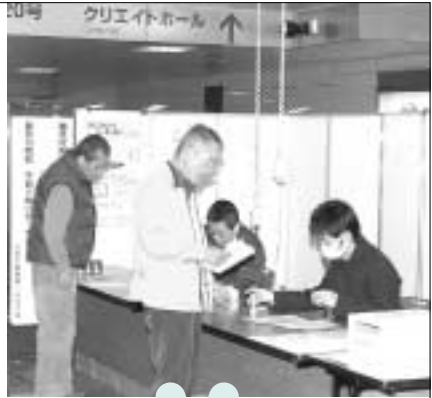
▶すいている2月中に申告を(八王子駅北口地下自由通路の臨時提出所)