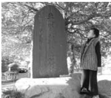
小仏関所跡地の西側にひっそりとたたずむ先賢彰徳碑