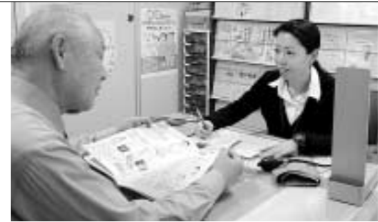
保健師などが、皆さんの生活習慣の改善点などを指導