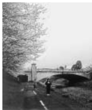
高尾地域には、さまざまな観光資源が(写真左から高尾山頂、八王子城跡のひき橋、南浅川のサクラ)