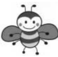
はちバスのマーク

はちバスは、バス路線のない地域を中心に走っている地域循環バスです。その車体やバス停に描かれています。(便利帳:74・75)