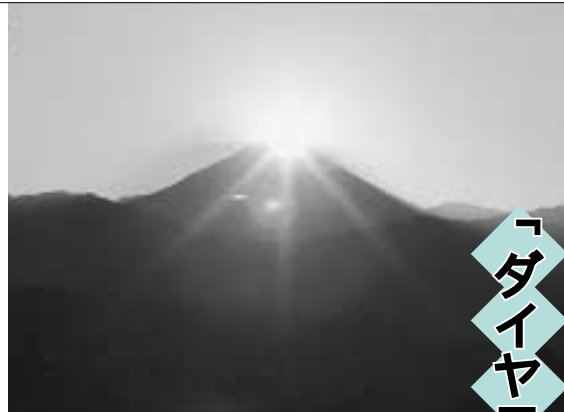
ダイヤモンド富士

冬至のころには高尾山の山頂付近から富士山の真上に夕日が沈む「ダイヤモンド富士」を眺めることができます。見ごろは、日没の午後4時30分ごろ。少し早めに出かけて、ゆっくりと太陽が富士山頂に沈む光景をご覧ください。