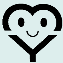
マイバッグのマーク

英字のMY(MY)のハート型と笑顔をデザイン。市は、不要なレジ袋の削減をめざしたマイバッグ(買い物袋)持参運動を推進するため、11月から職員が戸別訪問しながらマイバッグを配布しています。