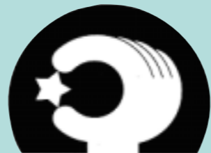
サイエンスドーム八王子のマーク

リサイクル運動の啓発を行っているキャラクターです。最近、マイバッグやマイはしを持つクルリもいます。(便利帳:65~68)