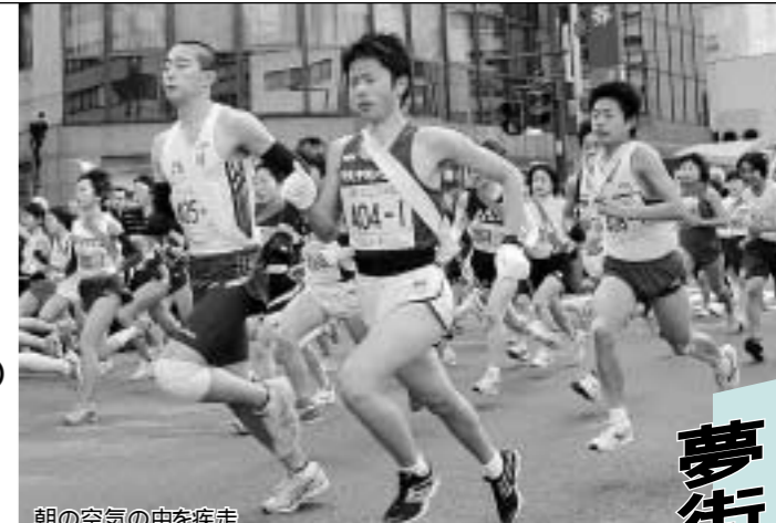
朝の空気の中を疾走