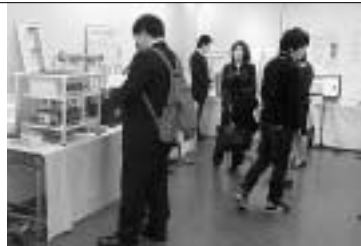
学生ならではの発想がいかされた展示物が並んで

地域の大学などと企業との交流を図るため、学生が研究成果やビジネスアイデアの発表・展示を行います。