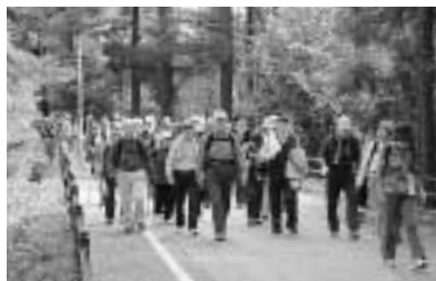
観光客やハイカーでにぎわう紅葉の高尾山

市は来年2月9日（土）に「げんきフォーラム」を開催します。テーマは「魅力ある観光都市をめざして」、高尾に外国人観光客を。市長ほか3名のパネリストとともに、本市がめざすこれからのまちづくりについて考えます。そこでこの討論会にパネリストとして参加していただける方を募集します。