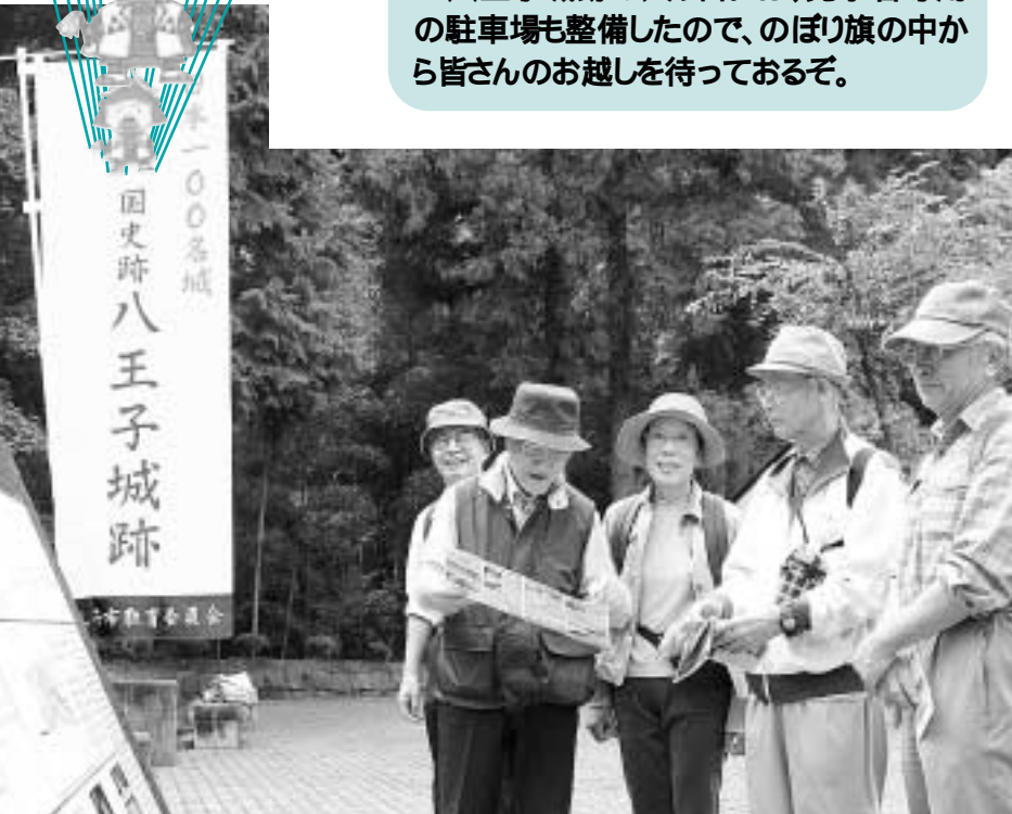
「うじてるくん」が八王子城跡の入り口などで見学者をお出迎え

八王子城跡の入り口には、見学者専用の駐車場も整備したので、のぼり旗の中から皆さんのお越しを待っております。