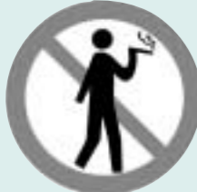
路上喫煙禁止マーク

市内全域で、路上での歩きタバコを禁止しています。このマークがある八王子駅北口周辺では、路上での喫煙行為そのものが禁止です。(便利帳:32)