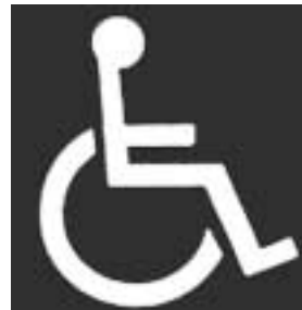
障害のある方が利用できる施設を表す世界共通のマーク

障害者用駐車スペースは、障害のある方などが施設を安全に利用できるように整備されたものです。そのため、建物の出入り口の近くにあり、車イスなどへの乗降が円滑にできるよう、幅も広く確保されています。このスペースには、左下の