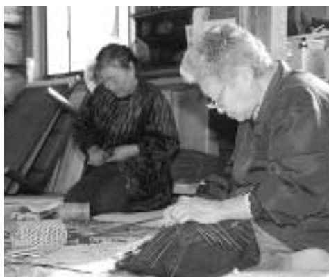
伝統の技を伝えようと活動する里山農業クラブの皆さん

い竹皮の部分をはぎ取って用いる。江戸時代の文化年間(1804～18)に宇津貫村で始まり、嘉永年間(1848～54)に由木村を経て、南多摩地域に広がったと言われている。