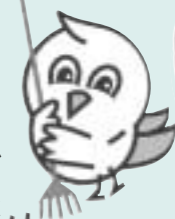
ありがとうクルー

皆さんとの協働で公園や道路などを管理していく「公共施設アドプト制度」のキャラクターです。現在199の地域の団体が清掃や美化活動などを行っています。(便利帳:35・78)