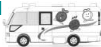
交通安全移動教育車「ストップくん」

「止まって安全確認」を呼びかけている「ストップくん」。交通安全祈願パレードなどに登場します。