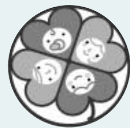
商品や広告へ掲載できる 応援企業のシンボルマーク