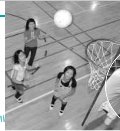
友だち同士でバスケット(浅川小で)

城山小では、7月から活動を行っています。最近では子どもが好きなことをして過ごせる場が増えてきていますよね。ですから子どもが集まってくるのびのび過ごせる環境をつくるのが我々の役目だと思っています。 子どもたちは、体育館や校庭で遊んだり、図書室で本を読んだりしながら、自由に過ごしていますよ。遊びを通じて人と人の付き合い方など、さまざまな経験を積んでいく子どもには、思いきり遊んでほしいです。また、クラブや学年の枠を越えて交流を広げてくれればうれしいですね。