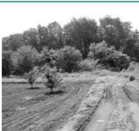
古墳が眠る雑木林

中央自動車道の八王子インターチェンジの南側には、緑深く雑木林が広がる「多摩のよこやま」と呼ばれたところの風景が残っている。北大谷古墳はその風景に守られるように存在する。この古墳の調査の歴史は古く、明治32年(1899)から現在まで、計3回