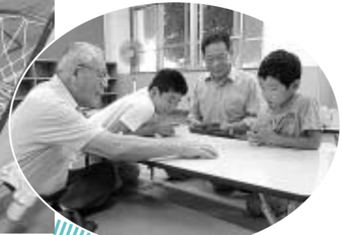
地域の皆さんとの交流も(横川小で)