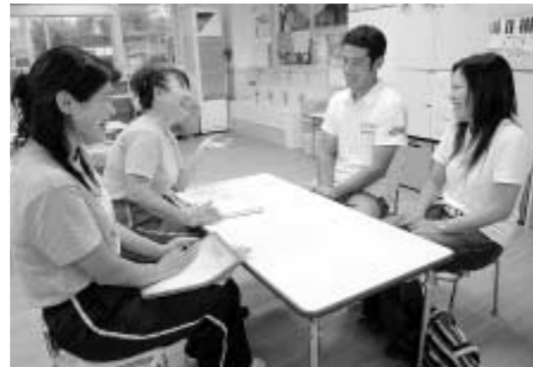
悩みや心配ごとなど気軽にご相談(みこも幼稚園で)

10月1日には、みこも幼稚園(初沢町)が母体となり、市内初の認定こども園が開設されます。園児の募集時期や相談方法など、詳しくは各施設までお問い合わせください。