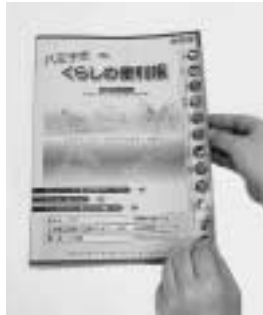
情報をより探しやすく

市の仕事や施設の紹介、手続きや申請方法などを掲載した冊子「くらしの便利帳」。このほど、全面改訂を行いました。10月中旬から、八王子市シルバー人材センターを通じて全世帯に配布します。10月31日を過ぎてもご自宅に届かない場合は、広聴広報室(広報担当 620・7228、FAX626・3858)までご連絡ください。また、お近くの事務所でもお取りいただけます。