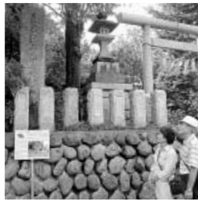
小門町には「大久保石見守長安陣屋 跡」の碑が

定員 72名(抽選) 費用 200円 申し込み 往復ハガキに「大久 保長安」と住所・氏名・電話番 号、返信面のあて名を書いて、