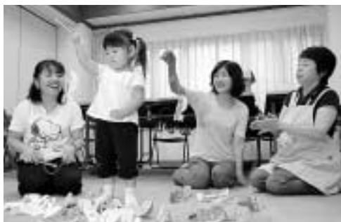
子育て応援団の皆さんと一緒に遊んで

子育て応援団「Beeネット」や保育園・児童館が連携し、手遊びや育児相談などを行う「子育てひろば」を各地域で開催しています。日時・会場など、詳しくはお近くの地域子ども家庭支援センターまでお問い合わせください。