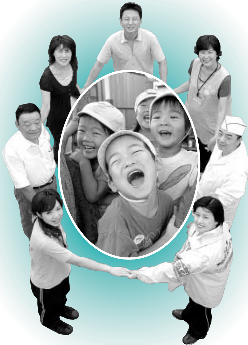
「まちぐるみ」で子どもたちの笑顔を支えて