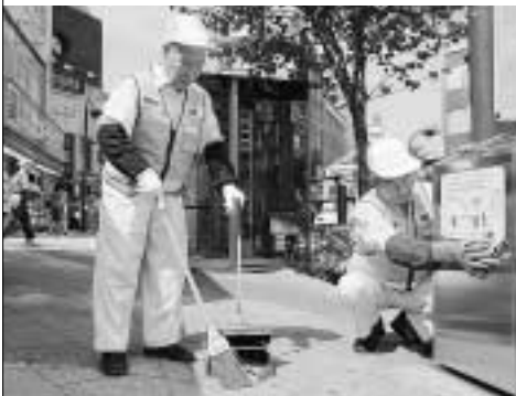
まちの美化にも一役買って(八王子駅北口の喫煙所の清掃活動で)

八王子市シルバー人材センターでは、60歳以上の方を会員として「自立・共働共助」を合言葉に、皆さんからの仕事をお請けしています。内容は、植木の手入れやふすまの張り替え、家事援助(洗濯・買い物など)、施設の管理・清掃、パソコン指導などで、主に短期・臨時的な作業です。お気軽にご相談ください。