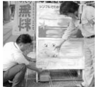
口頭での指導に従わない場合はステッカーで注意を喚起

8月23日に行った調査では、重点区域内での違法な置き看板の数は179件で、パトロール