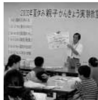
親子で環境について学んで(昨年の教室から)

環境学習室「エコひろば」で夏休み親子体験教室を開催します。 親子かんきょう実験教室 対象 市内在住で小学4年生以上のお子さんとその保護者(2人1組)