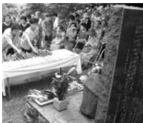
冥福を祈り、慰霊碑に花が手向けられて(昨年の集いで)

昭和20年8月5日 真夏の太陽がじりじりと照りつける暑い日だった。午後0時20分ごろ、新宿発長野行き四九列車は、中央本線湯の花トンネル(地名は猪の鼻)に差し掛かっていた。その時、突然飛来した米軍戦闘機P51が機銃掃射の雨を降らせた。