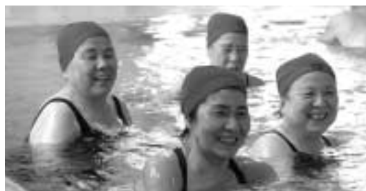
水の抵抗を肌で感じて

肩こりや腰痛解消に効果があると言われて いる「水中ウォーキング」の教室を開催します。 対象 市内在住の60歳以上で肩こりや腰痛 のある方