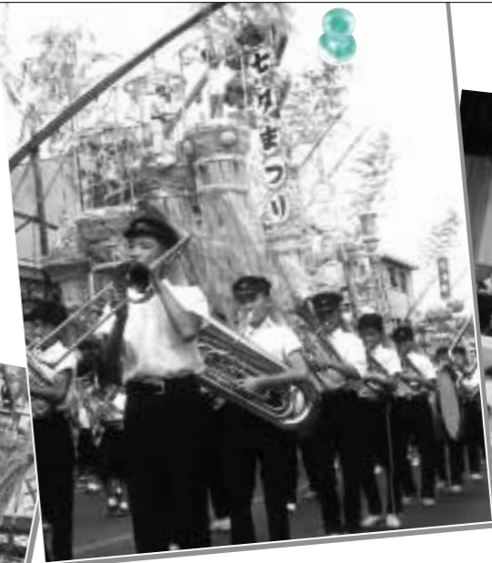
会場が甲州街道に(第4回・昭和39年)

関東近隣からも見物客が訪れるようになり、「八王子まつり」と改名しました。また、各町会の山車が初めて正式に参加。山車まつりへの一步を踏み出しました。