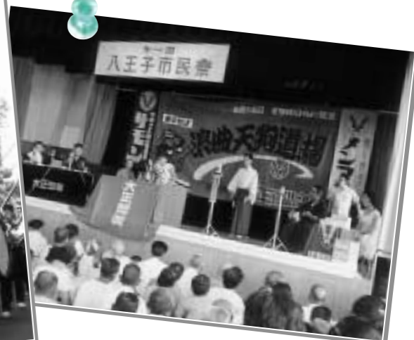
市民祭の名で誕生(第1回・昭和36年)

色鮮やかな七夕飾りの下、ブラスバンドがパレード。この年から主な会場が富士森公園から甲州街道に移り、現在のまつりの原型が完成しました。