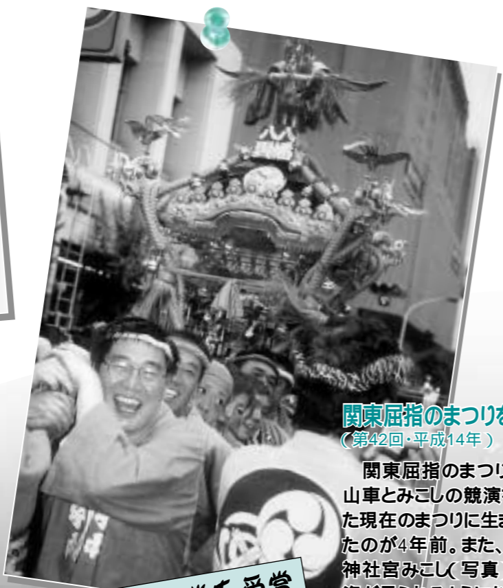
関東屈指のまつりをめざして(第42回・平成14年)

関東屈指のまつりをめざし、山車とみこしの競演を中心とした現在のまつりに生まれ変わったのが4年前。また、八幡八雲神社宮みこし(写真)の勇壮な姿が見られるようになったのもこの年から。翌年には、全国有数の伝統芸能をいかしたまつりと認められ、「地域伝統芸能大賞」を受賞しました。