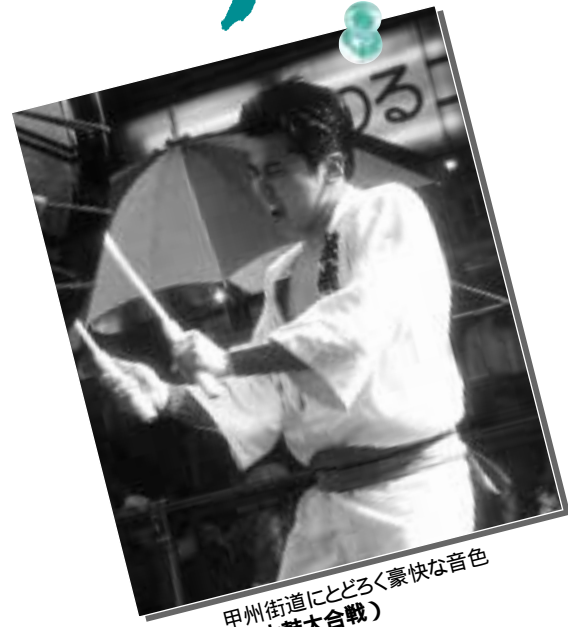
甲州街道にとどろく豪快な音色 (関東太鼓大合戦)