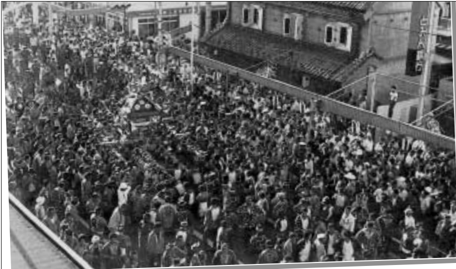
圧巻、千貫みこし初登場(第18回・昭和53年)

多賀神社の千貫みこしが初登場。3.7トンものみこしが揺れ動くさまは、まさに豪快の一語。その姿を一目見ようという観衆で甲州街道は大いににぎわいました。