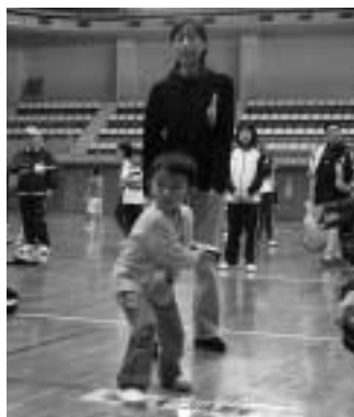
年齢に関係なくできるドッチビー

申し込み 直接、または電話で甲の原体育館へ 627・3300、 FAX 627・1568へ