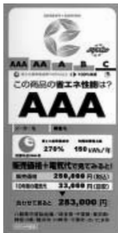
年間消費電力量や10年間の電気代などを表示

家庭で使用する電気は石油に代表される化石燃料などを使って発電されています。このとき排出される大量の二酸化炭素は地球温暖化の原因の一つ。皆さんの家庭で家電製品を購入するときに、省エネ型製品を選ぶことが、地球温暖化の防止につながります。 選ぶべき省エネ製品を 首都圏8都県市では、8月31日まで「夏季の省エネルギーキャンペーン」を実施。販売店で「省エネラベル」の店頭表示を行います。このラベルは、エアコン・洗濯機・冷蔵庫・省エネ基準達成率のランクを5段階で示し、販売価格と