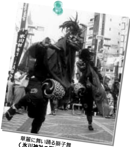
華麗に舞い踊る獅子舞 (氷川神社の獅子舞)

今年の「八王子まつり」は、市制90周年を記念し、8月4～6日に開催されます。見どころはなんと18台の山車の競演。壮麗な彫刻をあしらった山車が甲州街道を練り歩きます。夜には山車に明かりがともされ、昼間とは一味違う雰囲気にも、また、みこしや太鼓合戦など、見ごたえ充分の伝統芸能がめじろ押し。華やかに、そして勇壮に、語り継がれる伝統が織り成す絵巻を存分にお楽しみください。 なお、まつり期間中は、下図のとおり交通規制を行いますのでご注意ください。また、各催しの日程は下表をご覧ください。問い合わせは八王子まつり実行委員会 648・1531、FAX 648・1510。当日は621・2125へ。