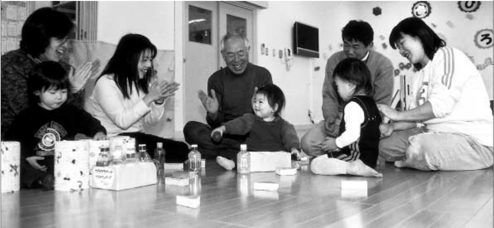
予算案の重点項目の一つ「子育て子育ての支援」は、世代を超えまちぐるみで(地域子ども家庭支援センター南大沢で)