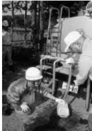
災害時の応急的な給水に欠かせない給水車