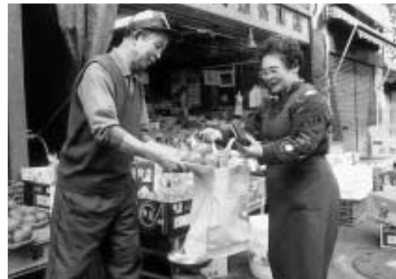
簡易包装やマイバッグの利用でごみの発生を抑制