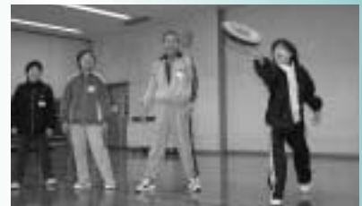
ルールはドッチボールとほぼ同じ

「エアスポーツ」「ドッチビー」体験 スポンジのフリスビ ーでドッチボールを する「ドッチビー」を 体験してみませんか。 対象 市内在住・ 在勤の方 日時 3月19日(日) 午前10時~午後 2時 会場 市民体育館 費用 無料 持ち物 室内用運動靴、昼食 申し込み 不要、直接会場へ 問い合わせ スポーツ振興課(20・7 335、FAX26・8554)へ