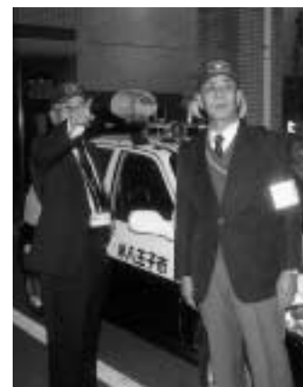
安全安心な暮らしにパトロールの強化や警視庁OBによる指導員を増員