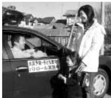
放火防止に市はパトロールを実施

「声かけよう 家族みんなで火の用心」をスローガンに、3月1日から7日まで春の火災予防運動が行われます。期間中は住宅用火災警報器の設置を呼びかけたり、防火診