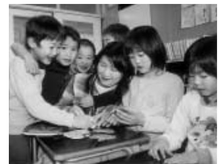
メンタルサポーターが、子どもたちが発する“サイン”を早期に発見