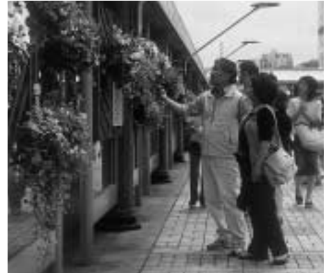
ゆったりと花を眺めながらの買い物も (昨年の展示から)

内容 壁掛け型で二人で持てるもの 募集点数 50点(抽選) コンテナガーデンコンテスト 募集団体数 20団体(抽選) コンテナと花材は支給します。 展示期間 4月29日～5月7日、 4月29日～5月25日 申し込み 往復ハガキに催し名と住所