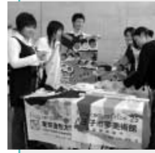
フラッグギャラリーの準備も着々と(東京造形大で)

今年で3回目を迎えるフラッグギャラリープロジェクト。11月17日まで、東京造形大学の学生がデザイン・製作した40種類のフラッグが西放線線「ロード」を飾ります。学生の作品を発表したい