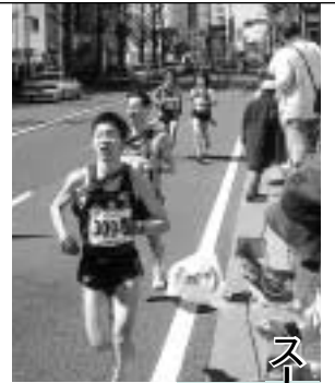
スパーアルプス全関東八王子夢街道駅伝