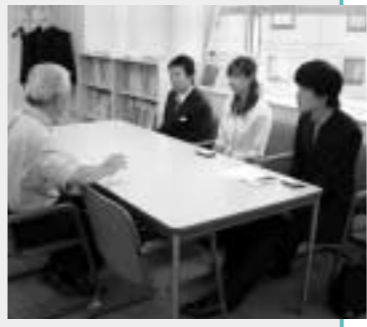
企業経営のノウハウを直接聞いて

大学と、気軽に芸術にふれてもらいたい夢美術館、そして中心市街地の活性化をめざす地元商店街。それぞれの思いが重なり連携・協力して実現しました。