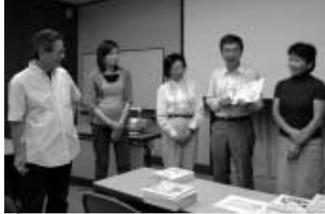
いちよう塾の講座「声に出して読みたい! 絵本」の皆さん

八王子学園都市大学「いちよう塾」はさまざまな個性を持つ大学などが集積する学園都市ならではの取り組みです。昨年9月の開学から1年。ナノテクノロジー(10億分の1の世界での技術)といった専門的な分野から環境・介護などの身近な内容まで、知識や趣味の幅を広げる豊富な講座を取りそろえています。この塾の生徒は学生、サラリーマン、高齢者などあらゆる層の皆さん。同じ学びの場での出会いの中から、交流の輪が広がっています。