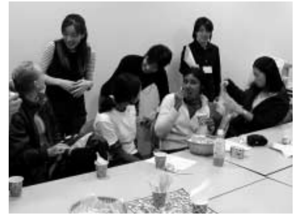
見学後の交流会では友だちの輪も広がって