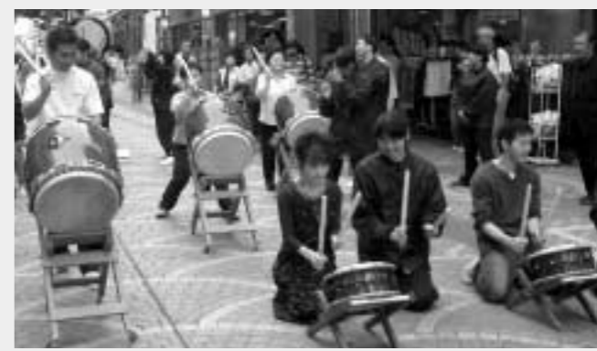
若い力に引き込まれて、交流することで楽しさも倍増(学生天国で)

子学生委員会。市内の大学などの学生が集まり、学生同士の連携や市民の皆さんとの交流などを通じて、まちに活気と活力を生み出す活動をしています。 発足10周年を迎え、5月には西放線線「ロードで、誰もが気軽に楽しく交流できるイベント」学生天国」を開催。多くの方が来場し「学生のまち八王子」の名を大いにアピールしました。