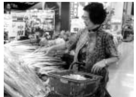
包装をしていない商品を買うのも、エコ生活への第一歩

10月5日は都の「レジ袋NOデー」。買い物には買い物袋(マイバッグ)を持参し、レジ袋や不要な包装は断る