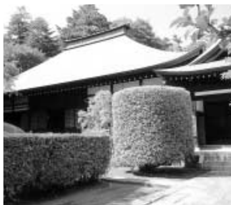
しっとりした雰囲気のある廣園寺