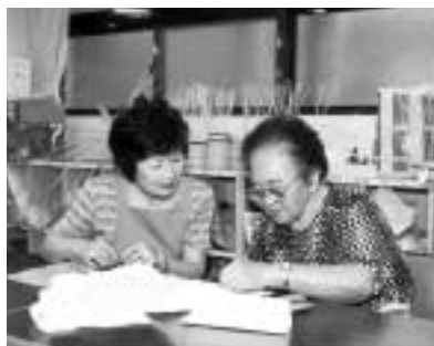
ボランティア活動で楽しいひとときを

高齢社会を支えるボランティアのあり方と地域での実践の手掛かりを学ぶため、高齢社会に生きるボランティア実践講座を開催します。