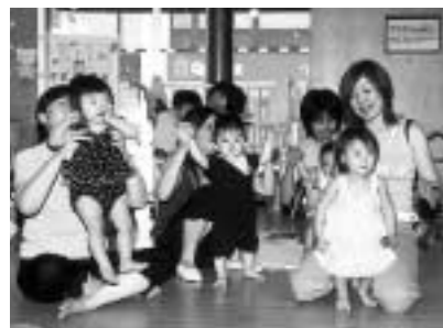
みんなで仲良くリズム体操

対象 1歳~就学前のお子さんとその保護者(2人1組) 内容 リズム体操、絵本読み聞かせなど