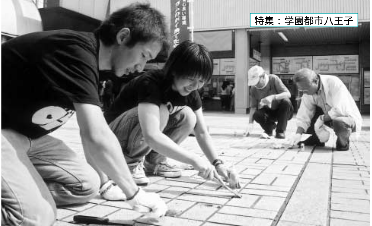
▶ 地域や企業と力を合わせて美化活動(チョーインガムの除去)に汗を流す首都大学東京の学生たち(南大沢駅前広場のクリーンデー)