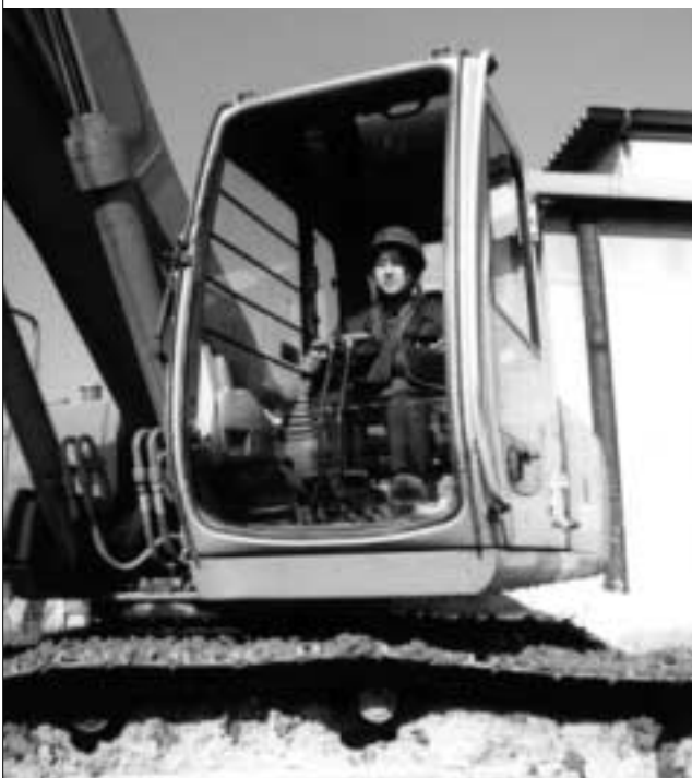
あらゆる分野で、自分の持てる力を発揮して(横川町と長房町をつなぐトンネルの工事現場で)

市は、男女がお互いを尊重し合い、持っている力を発揮し、一人ひとりがいきいきと暮らせる男女共同参画社会の形成を進めています。その推進拠点となる「男女共同参画センター」が、12月13日にクリエイティブホール8階にオープンします。センターには相談室や交流スペースが設置されますので、気軽にご利用ください。問い合わせは男女共同参画課(48・2230、FAX44・3910)へ。