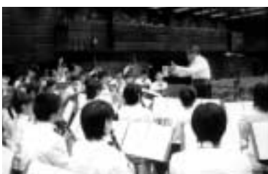
▶本番前に入念にリハーサル音楽祭の様子上映