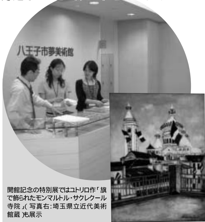
開館記念の特別展ではユトリロ作「旗で飾られたモンマルトル・サクレクール寺院」(写真右:埼玉県立近代美術館蔵)も展示