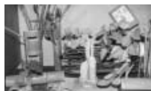
木竹細工の花器も人気のひとつ

あつたかホール内のリサイクル工房では、下表のとおり、小・中学生向けの教室を開催します。申し込みは不要おもちゃの修理教室を除く、時間は午前10時から午後3時までです。お子さんだけでも、親子でも参加できます。