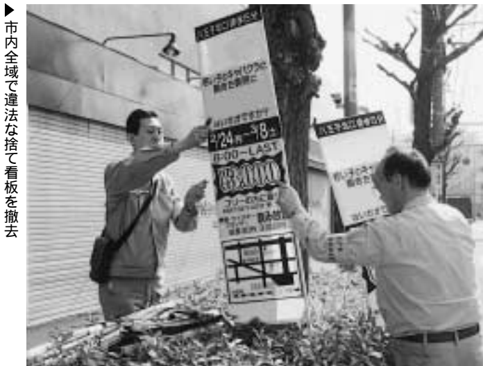
▶市内全域で違法な捨て看板を撤去

そこで市は、暴走行為を許さない生み出さないまちにしてゆこうと、「暴走族追放条例」を制定しました。この条例では、暴走行為をしている者に対し、声援を送るなど、暴走行為をあおる行為を禁止し、違反した者に対しては罰金を科す。市内の自動車部品販売店やガソリンスタンドなどの事業者に対し、暴走行為を助長しないように協力を求めるべく、ことなどを定めています。なお、条例の施行は7月を予定しています。問い合わせは交通対策課(☎20-7257、FAX26-3137)へ。