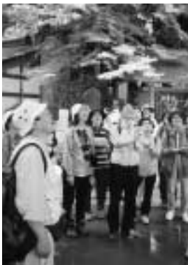
高尾山の自然に触れて

子市役所9階八王子観光協会 〒192-8501 ☎20・7381、FAX 23・7782 へ