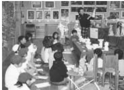
作品展で友だちの作品を觀賞

募集人数 5名程度 申し込み 1月31日までに直接、市役所8階学事課(☎20・7339、FAX27・811)へ