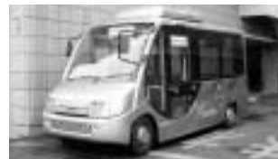
車イスも利用可能な小型バス

地域循環バスは、狭い道でも走ることができる20人乗りの小型バスで、車イスも利用できるように床面の段差をなくした「低床ノンステップバス」に決定しました。また、車体の一部に企業などのラッピング広告を掲載する予定です。広告掲載についてのお問い合わせは交通対策課（☎20-7257、FAX26-3137）へ。