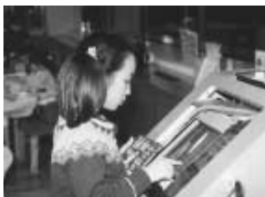
検索用コンピュータで予約も可能に（中央図書館で）

なお、新システムの導入にあわせて図書館の利用方法なども、下表のとおり変更となります。問い合わせは中央図書館 ☎64・4321、FAX ☎27・7001。