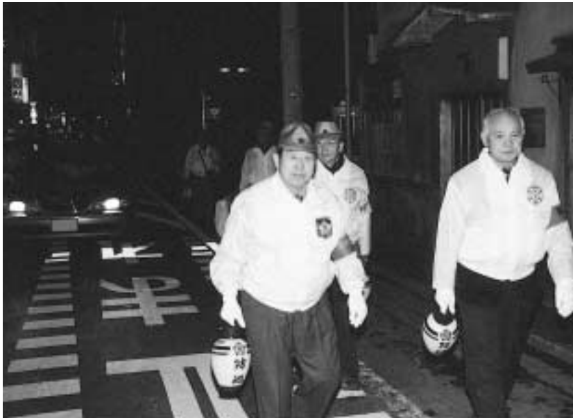
八王子駅周辺地域では地元の方などによる自主的な夜間パトロールも

ホームページアドレス http://www.city.hachioji.tokyo.jp/ モバイル(携帯電話)版 http://www.city.hachioji.tokyo.jp/m/