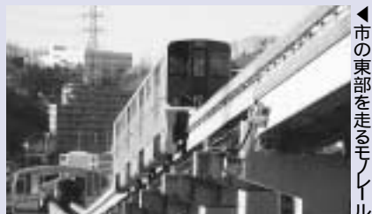
市の東部を走るモノレール

問い合わせは多摩都市モノレール (☎042・526・7816、FAX042・526・7857)。 または交通対策課 ☎20・7257、FAX26・ 3137)へ。