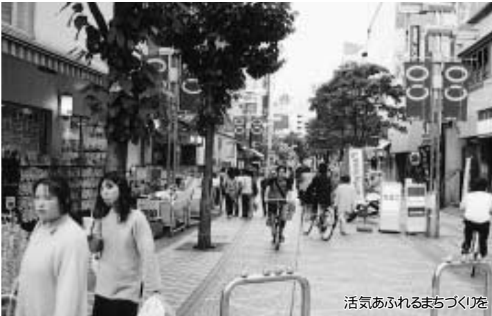
活気あふれるまちづくりを

発行 八王子市(〒192-8501 元本郷町三丁目24番1号) 市役所の代表電話 ☎26-3111 編集 企画政策室(広報担当)