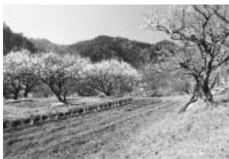
展示される「山里の春」

日時・会場 7月31日～8月4日の午前10時～午後7時：いちよホール 2日は午後のみ、4日は3時まで 8月5～9日の午前8時30分～午後7時：市役所2階市民ロビー 問い合わせ 環境保全課 ☎20・7268