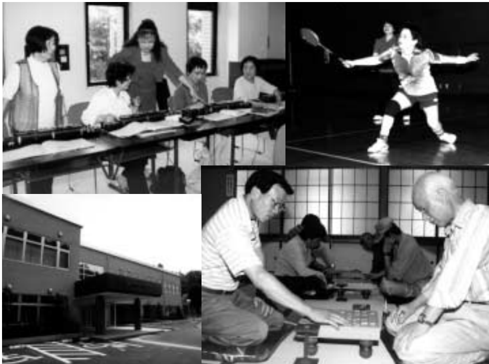
市内の市民センターで活動する皆さん(左下は7月20日にオープンする加住市民センター)

市は、皆さんの生涯学習活動や地域の方たちのふれあいを深める交流の場として、市内の各地域に市民センターの建設を進めています。このほど16番目の施設として、加住市民センターが完成。7月20日にオープンし、一般利用が21日から始まります。