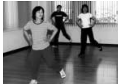
簡単エアロビクス( 恩方市民センターで )

申し込み 各市民センター・体育館・事務所、市民球場事務所、市役所8階体育課にある申込用紙に記入して、7月5日(必着)までに郵送または直接、八王子市役所体育課(〒192 8501 20・7335)へ 会場は、市内の会場(人数に見合った広さ)を各団体で確保していただきます。