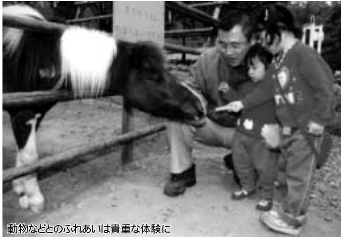
動物などとのふれあいは貴重な体験に