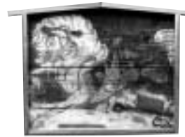
普段見ることができない浄福寺の「暴れ馬の絵馬」などの見学も

集合 5月26日(日)午前10時に切通しバス停前雨天決行。解散は4時(浄福寺で) コース 切通し 宝生寺 下原刀の碑 小田野会館(昼食) 観栖寺 八王子車人形積古場 浄福寺(約6キロ) 定員 50名(抽選) 費用など 200円(保険料) 昼食は持参を 申し込み 往復ハガキに「案下みち」と氏名(複数可)・住所・年齢・電話番号・返信面のあて名を書いて5月21日(必着)までに八王子市郷土資料館(〒192 0902上野町33 22・8606)へ