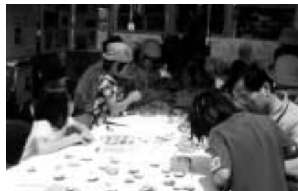
昨年の木工教室で