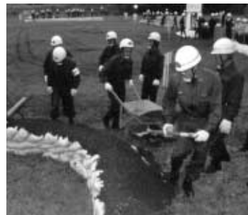
災害は日ごろの備えが大切

の倒壊なども想定した総合水防訓練を市と東京消防庁第九消防方面本部管内の消防署や市消防団、関係機関が協力して行います。 日時 5月19日(日)午前9時30分～正午 会場 清川河川敷広場(清川町) 問い合わせ 防災課 20-7207-8