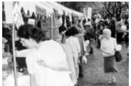
福祉団体などによる模擬店

日(日)午前10時～午後3時(小雨決行) 会場 富士森公園 問い合わせ ボランティアセンター(485776) リサイクルと映画会 リサイクルや環境に関するゲームと映画、バグタイムの上映を行います。日時 5月26日(日)午後2時～4時30分 会場 あつたかホール 564126 定員 200名(先着順) 費用 無料 申し込み 不要、直接会場へ シアター川口 作品 「自転車泥棒」 監督 ビットリオネシカ 日時 6月2日(日)午前10時～11時30分、午後2時～3時30分 会場 川口公民館 548450 定員 70名(先着順) 費用 無料 申し込み 不要、直接会場へ みなみ野まつり2002 内容 地域の団体や大学などによる作品の展示やイベント大会、フリーマーケットなど 日時 5月26日(日)午前10時～午後4時(小