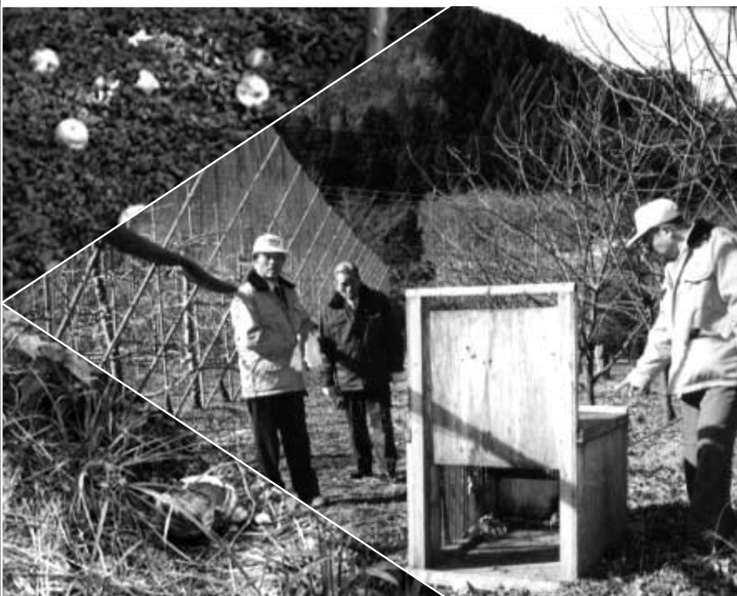
さまざまな対策を講じてきたにもかかわらず、多くの被害が

そこで、昨年10月に獣害対策基本計画を策定し、12月には「獣害対策プロジェクトチーム」を発足させました。今後は、野生動物との共生についても考えながら、被害に対して有効な対策を検討してゆきます。問い合わせは農林課 20・7375(入)。