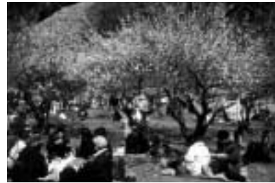
梅の下で春を感じて