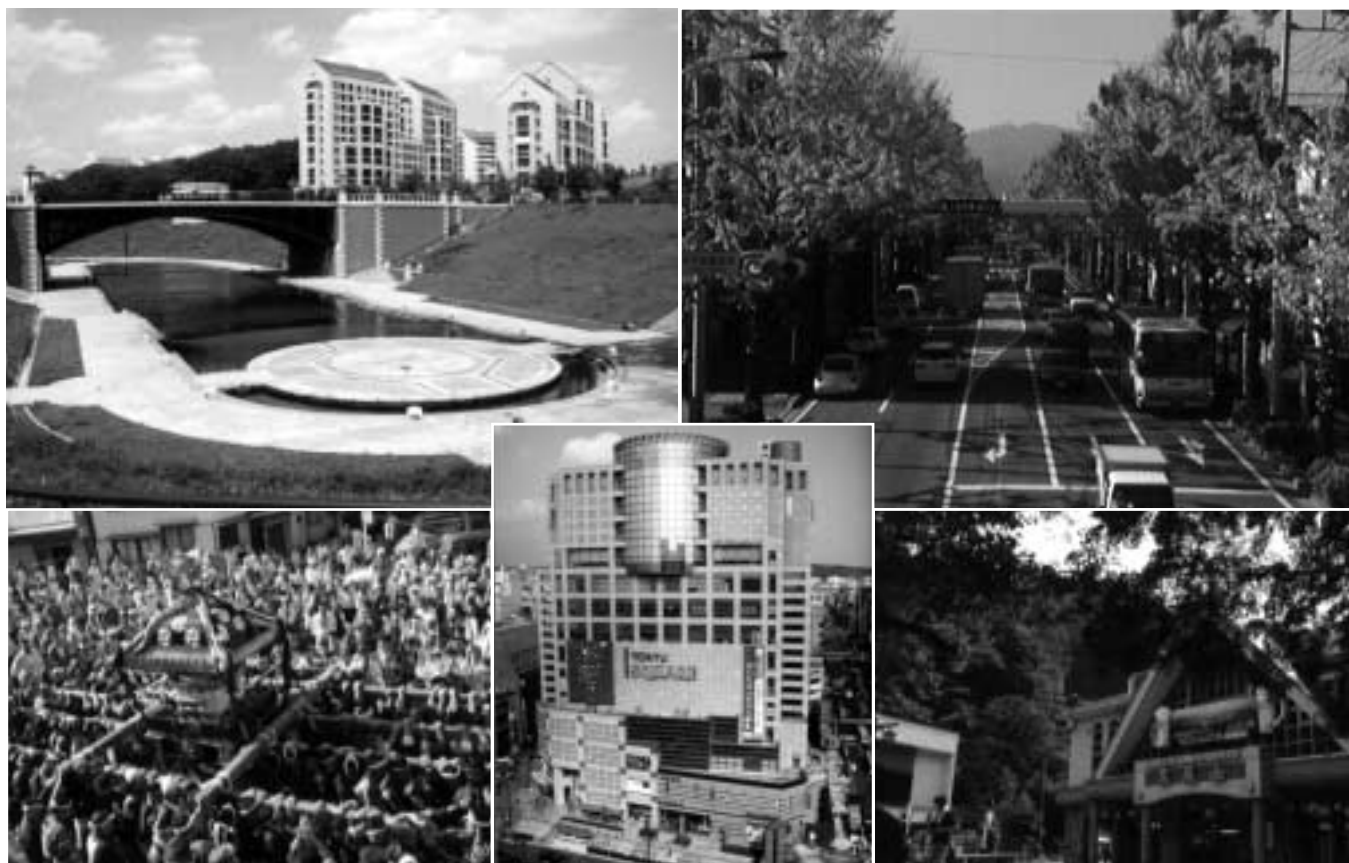
候補には色々な八王子の「顔」が(これらの写真は、展示物と一部異なります)