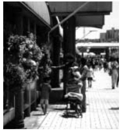
色とりどりの花が並んで

申し込み 往復ハガキに催し名と住所・氏名・電話番号(は代表者の住所・氏名・電話番号・人数・グループ名)返信面のあて名を書いて、3月31日(必着)までにフラワーフェスティバル由木「春のガーデニングコンテスト」係(〒192 0364南大沢2 2パオレビル4F 74・9418)へ