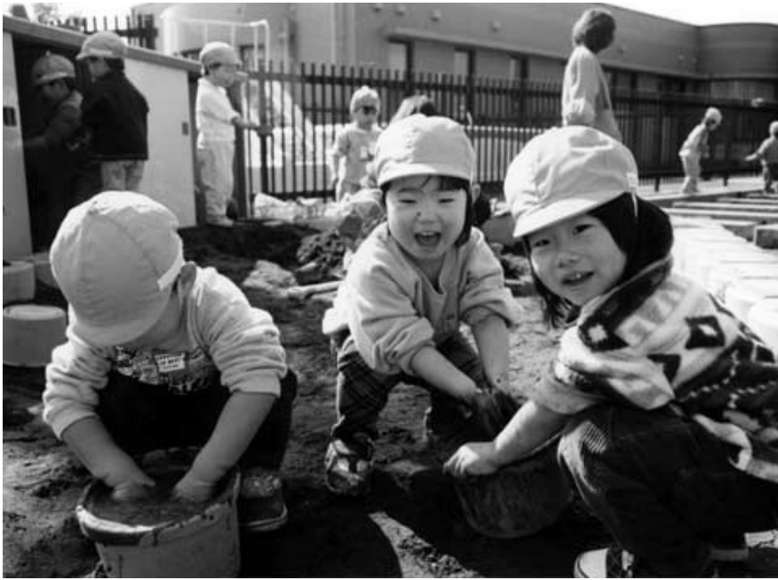
子育てを支える相談を充実します(写真はみなみ野保育園で)

保育園と幼稚園で子育て相談を開始 育児で悩んだら お気軽に相談を 市内の全保育園・幼稚園で四月一日から子育て相談が始まります。通園している園児だけでなく、就学前の子さんをお持ちの方ならどなたでも相談が受けられます。子育てに関することならなんでもお気軽にご相談ください。