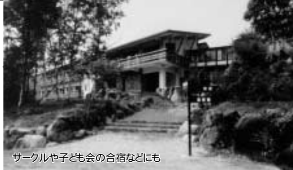
サークルや子ども会の合宿などにも