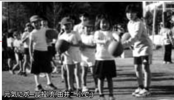
元気にボール投げ(由井二小で)

申し込み 往復ハガキ(1人1枚2名まで)に「多摩手箱」 と住所・氏名・年齢・電話番号、返信面のあて名を 書いて、3月3日(必着)までに八王子市文化振興 財団(〒192 0066本町24 1 21・3005)へ