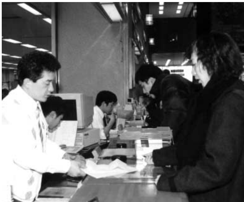
便利な市役所をめざして