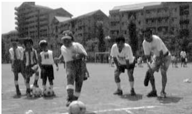
エヌピーオー・フュージョン長池では長池小と共催で、夏休み期間中の37日間、様々な催しを行いました(写真はサッカー教室で)

人のため、また、自分たちの地域のために、身近な活動をコツコツと続けている 市内にはそんなサークルやボランティア団体がたくさんあります。こうした、営利を目的としない市民活動団体のことをNPOといいます(NPOについては3ページ参照)。ここでは、NPOの説明や実際に活動を行っている団体をご紹介します。