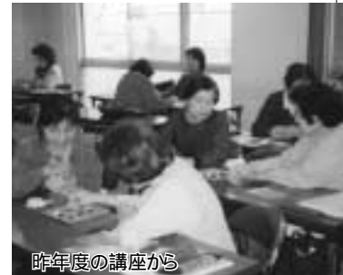
昨年度の講座から

受講者の決定 定員を超えた科目は、9月19日午後2時から婦人センターで公開抽選を行います。結果は9月30日までに通知します 午前・午後の部では、二歳以上で未就学のお子さんをお預かりします。