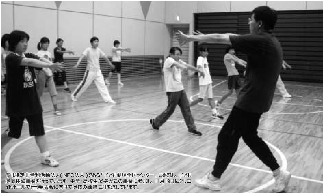
市は特定非営利活動法人(NPO法人)である「子ども劇場全国センター」に委託し、子ども演劇体験事業を行っています。中学・高校生35名がこの事業に参加し、11月19日にクリエイトホールで行う発表会に向けて演技の練習に汗を流しています。