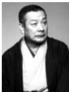
古今亭志ん朝さん

開演日時 12月9日(土)午後2時 会場 いちょうホール 出演 古今亭志ん朝さんほか 入場料 3,500円(全席指定) チケット販売 9月9日(土)午前10時から、いちょうホール、市民会館、南大沢文化会館、八王子そごう、くまざわ書店本店、いそま書店本店、ハッピーイン高尾駅前店、ディスクハローで 電話予約 9月9日午後1時からいちょうホール(21・3005)で