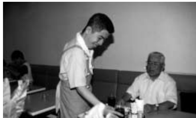
クリエイティブホールにある喫茶店は同センターで運営