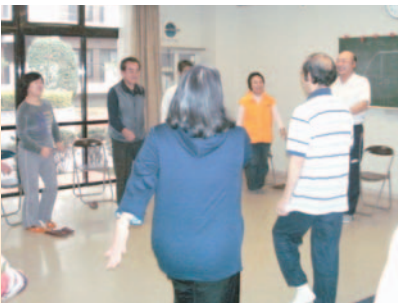
▲皆さんと一緒に健康づくりの教室も開催しています。

判定の結果、介護予防の必要があるとされた方には、運動教室等にお誘いし、いつまでも介護を必要とせずに暮らし続けられるよう支援していきます。