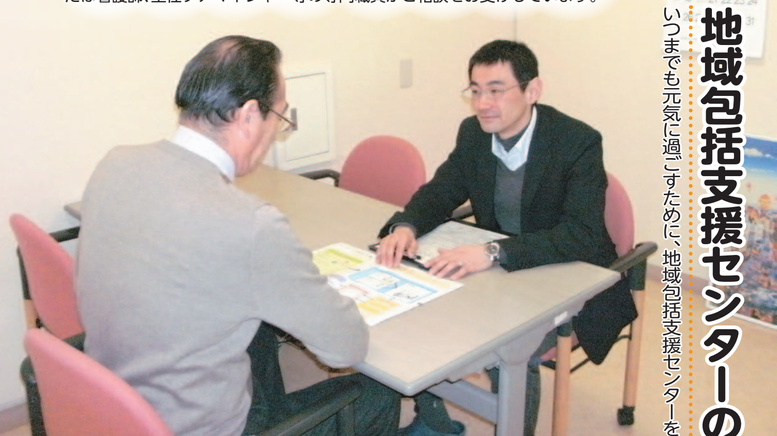
▲高齢者・ご家族のよろず相談承ります。

いつまでも元気に過ごすために、地域包括支援センターを利用しましょう。 地域包括支援センターのご案内