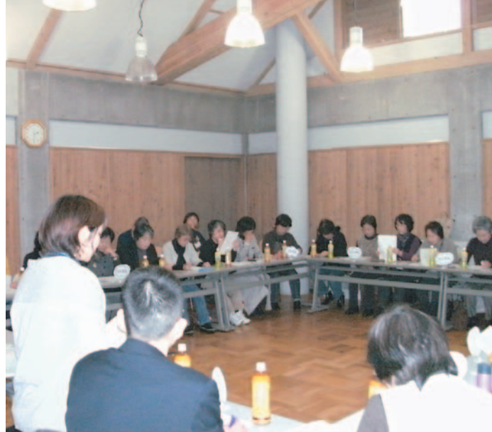
▲地域の安心ネットワークづくりを進めます。

また、このたびの変更では、より一層センターと地域の連携を強化するため、民生委員の担当地区に合わせてセンターの担当地区を設定しました。一部の町で担当センターがまたがることとなりますので、どうかご理解とご協力を願います。