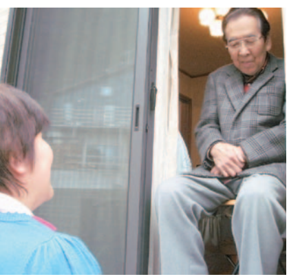
▲訪問や見守り活動は欠かせません。

職種 保健師又は看護師(非常勤) 問い合わせ 地域包括支援センター長沼(☎648・4340)