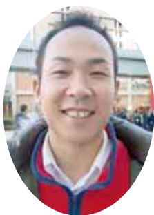
▲気象予報士の天達武史さん

フジテレビ「情報プレゼンターとくダネ」に出演している気象予報士・天達武史さんによる環境講演を開催します。環境ドキュメンタリー映画「ライフのちをつなぐ物語」の上映も行います。