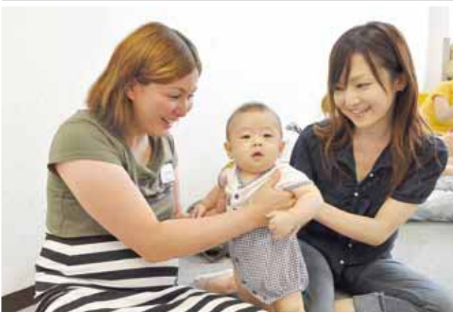
▲あかちゃんに触れるだけでなく、先輩ママに相談も

対象 市内在住の妊婦 日時 10月9日(火)午前10時30分～正午 会場 地域子ども家庭支援センター館(たて) 定員 10名(先着順) 費用 無料 申し込み 9月18日から電話で地域子ども家庭支援センター館(☎661・0072)