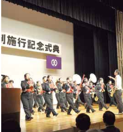
▲式典を盛り上げる吹奏楽部の演奏

本市は、大正6年(1917)に誕生しました。市はこれを記念して毎年、市政や文化の向上に功労のあった方を表彰し、市政に協力いただいた方には感謝状を贈呈しています。今年の式典は、10月1日(月)午前10時からいちようホールで開催。表彰式のほか、片倉高校吹奏楽部と日本工学院八王子専門学校による演奏や海外友好交流都市のパネル展示も行います。