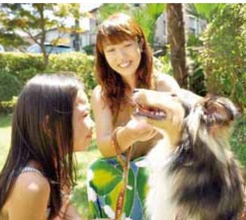
▲愛情と責任を持って

公園などで犬を放すことや散歩中にフンや尿で道路などを汚すことはルール違反です。犬を制御できるようにリードを短く持ち、フンや尿は自宅まで済ませてください。散歩中にしてしまった時は、フンは持ち帰り、尿は水で流しましょう。なお、保健所では飼い主のマナーアップを呼びかける啓発用看板を無料で配布しています(1世帯1枚)。また、飼い犬は、市への登録と狂犬病