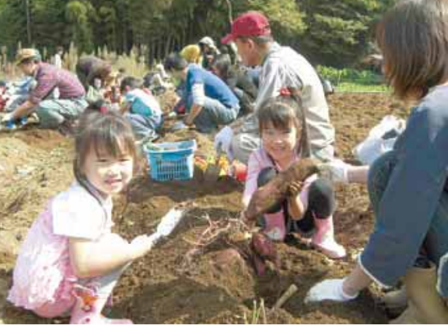
▲大きいサツマイモ採れたよ