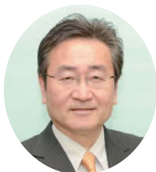
市長 石森 孝志(54)