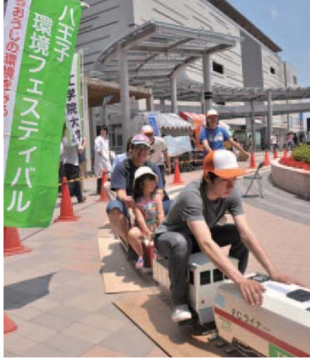
▲さまざまな趣向で環境をアピール

申し込み 電話、または「環境フェスティバル」と希望番号、団体・企業名(フリーマーケットは氏名)・担当者名・連絡先を書いて、3月30日(必着)までにファックス、Eメールで同実行委員会事務局(環境政策課内 ☎620・7384、FAX626・4416、Eメール b110400@city.hachioji.tokyo.jp)へ