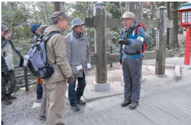
▲高尾山の魅力を紹介するボランティアガイド

内容 ①観光案内人：高尾山麓駐車場内の観光案内所で高尾山や市内観光地の情報を提供、②見どころガイド：ケーブルカー高尾山駅から薬王院までの案内 活動期日 6月～来年3月 (②は土・日曜日、祝・休日など) ※月2回程度参加。4・5月に事前研修を行