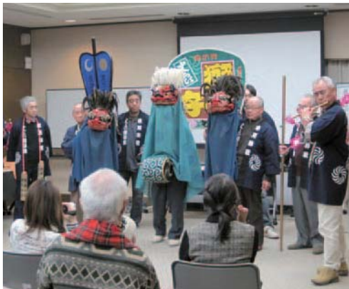
▲八王子の伝統文化を体験して