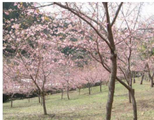
▲一足早く、春を感じて

3月11日から25日頃まで、園内100本の河津桜が花を咲かせます。散策をお楽しみください。