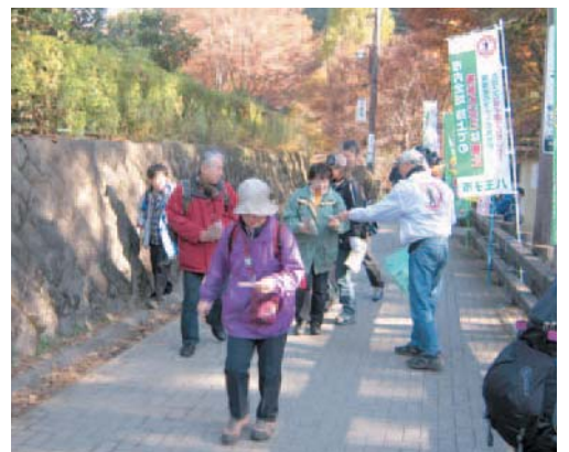
▲高尾山での喫煙マナーアップキャンペーン

市は、定期的に市民・事業者の皆さんと一緒に喫煙マナーアップキャンペーンなどを実施するとともに、路上喫煙の防止に関する条例を制定し、迷惑な喫煙の防止に努めています。条例の制定後には、タバコのポイ捨てが大幅に減り、取り組みの成果がでてきている