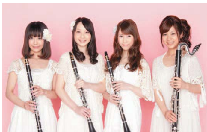
▲星空コンサートに出演する「カラフル」

会場・申し込み サイエンスドーム八王子(〒192-0062大横町9-13 ☎624・3311、FAX627・5899)