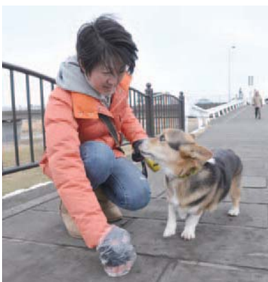
▲外出先でのフンは必ず持ち帰って

現在市では、広報紙や看板などでの啓発活動のほか、市民の皆さんからの通報により飼い主が判明している場合には、直接指導を行っています。罰金制度については、一部の心無い飼い主への取り締まりにかかる人件費など、費用対効果を考えると、現時点では導入の予定はありません。今後は、外出先でフンをしらないよう「トイレは自宅で済ませること」などを強調した広報活動により、飼い主の責任と自覚を促していくよう、努めていきます。