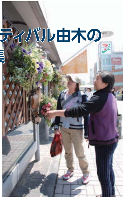
▲色鮮やかな花が目を楽しませて

申し込み 往復ハガキにコンテスト名と住所・氏名・電話番号(②は人数・グループ名も)、返信面の宛名を書いて、3月24日(必着)までに同祭典委員会事務局(〒192-0063元横山町1-29-3 学園都市文化ふれあい財団内 ☎648・1531、FAX648・1510)へ