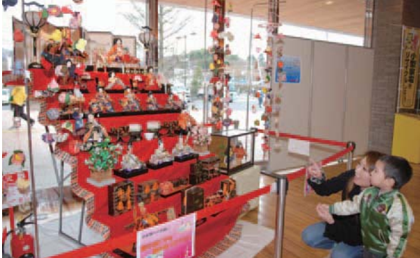
▲ひな飾は交流ホールに展示