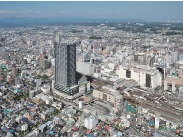
▲再開発で大きく姿を変えた八王子駅南口

昨年12月、学識経験者や公募市民で構成する「八王子駅南口周辺地区まちづくり方針検討委員会」から市へ、提言書が提出されました。提言書は、八王子駅南口周辺の新たなまちづくりの方向性について協議・検討した成果をまとめたものです。市はこれを基に、今後のまちづくりの方針を策定していきます。