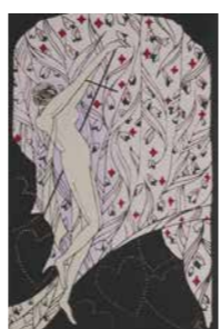
小林かいち 絵はがきセット《灰色のカーテン》より(1925〜1926年頃)

6月23〜29日は男女共同参画週間。今年の標語は「あなたらしさが、社会のチカラ」。男女共同参画課(☎648・2230)