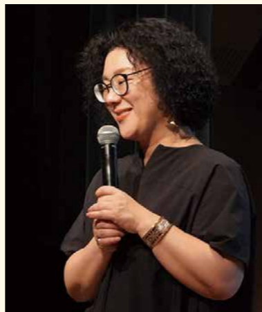
「普通」ってなんだろう

私らしさを支える「居場所」 皆さんにとって「私らしくいられる場所」はどこでしょうか。家や学校、職場など人によってさまざまです。心からリラックスして、自分らしく振る舞い、そして疎外感を持たずに他者と共存できる——そんな場所を、「居場所」と呼べるのかもしれないですね。 「居場所」は、私たちに「ここにいていい」という感覚をもたらします。この安心感こそが、「私らしさ」を受け入れるための土台となるのではないのでしょうか。