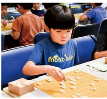
夏休みの思い出に真剣勝負

対 市内在住・在学の小・中学生 内容 シニアボランティアの指導による囲碁教室 日7月4・18日、8月1・22日、9月5・19日の午前9時30分〜11時30分 会 東浅川保健福祉センター(☎667・1331) 定 各20名(先着順)