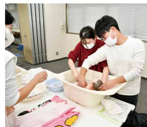
赤ちゃんを迎える準備を

対 対象 日 日時 時 時間 会 会場 定 定員 費 費用 問 問合先 申 申込方法