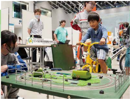
工夫を凝らしたブースが盛りだくさん

二次元コードをスマートフォンなどで読み取ると、市のホームページなどがご覧いただけます。