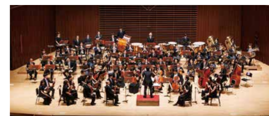
大迫力の演奏を体感