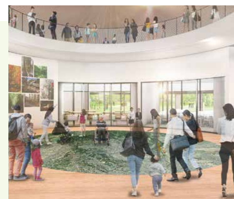
桑都・八王子の歴史や自然の魅力を伝えて

申請方法など、詳しくは市のホームページをご覧ください。 ※改修の補助金は予算額に達し次第、終了します。 募集期間 6月1~19日 問 住宅政策課(☎620-7385)