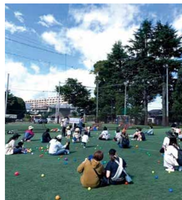
親子でのびのび遊ぼう

ボールや楽器などを使ったプログラムで、自然の中で五感を使った遊びができるほか、子育て相談も受け付けています。詳しくは子育て応援サイトををご覧ください。