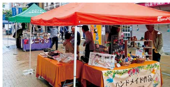
福祉をもっと身近に

対市内在住・在勤・在学で、知的・精神・肢体不自由障害のある方(介助者の同席可。初めての方を優先) 内容 プログラ