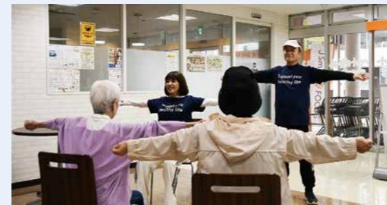
皆さんの運動習慣を応援

※小学生以下のお子さんは保護者同伴で。ペットの同伴はできません(盲導犬、介助犬を除く)。