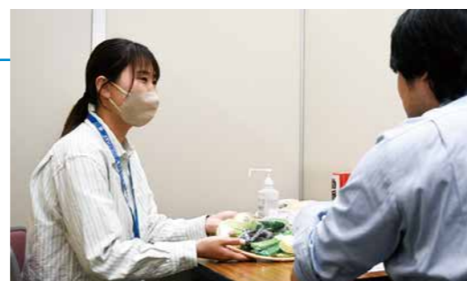
食品サンプルなどを使ってわかりやすく説明

申し込み 電話で東浅川保健福祉センター（☎667・1331 ☎667・7829）、または申込フォームから