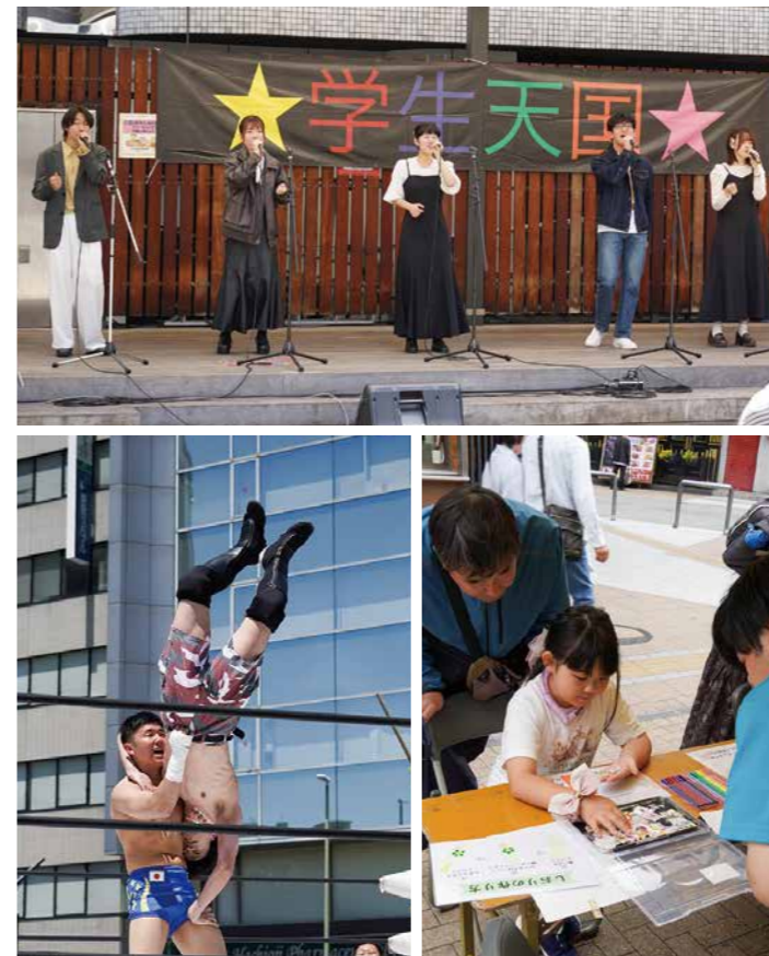
まちに新たな活気を生む学生のアイデアやパフォーマンス

二次元コードをスマートフォンなどで読み取ると、市のホームページなどがご覧いただけます。