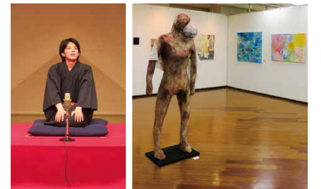
未来の落語家や芸術家の卵たちが磨いた腕前を披露

日時 5月10日(日)午前10時~午後5時 会場 八王子駅北口西放射線ユーロード、えきまえテラス、学園都市センターなど 問い合わせ 八王子学生委員会事務局(☎646・5740 ☎646・2663)