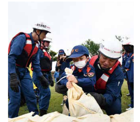
もしもの時の対応を確認

集中豪雨や台風などの水害に備え、消防署や市消防団と協力し、総合水防訓練を実施します。さまざまな水防対策をはじめ、家庭でできる浸水防止対策の実演や土砂災害からの救出訓練などを行います。また、災害時に使用するトイレカーを公開します。