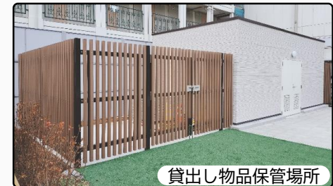
貸出し物品保管場所