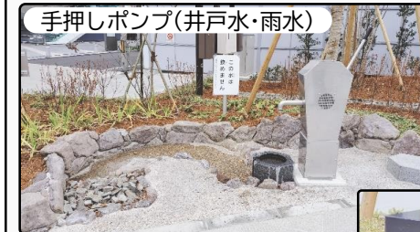
手押しポンプ(井戸水・雨水)