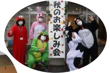
町会、子ども会のスタッフ、戸吹クリーンセンター職員も仮装して参加しました！