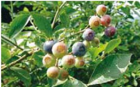
大粒で、強い甘みが特徴

22年から「広報はちおうじ」を活用し広く周知しており、28年度も7月15日号に写真付きで紹介した。