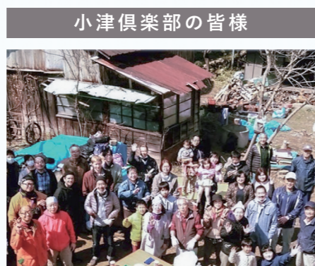
小津倶楽部の皆様

再生した古民家を拠点に、地域の豊かな自然環境を活かした農作物の収穫体験などのイベントを実施し、町の魅力を発信することで、地域の活性化に取り組んでいます。