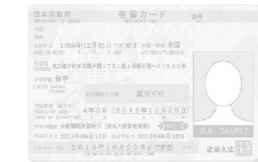
●在留カード(おもて・うら)外国籍の方は必ず必要