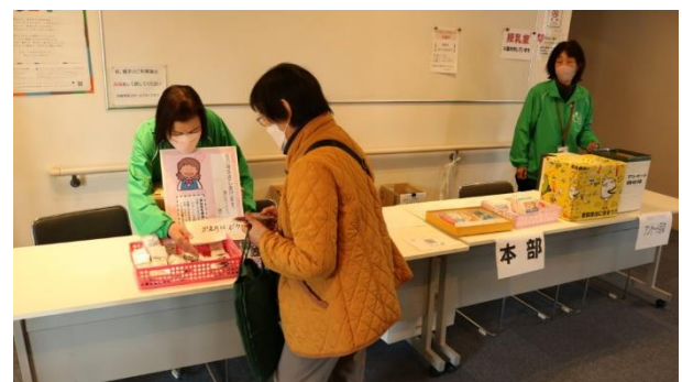
最後にアンケート書いていただき、粗品抽選会で運だめし!