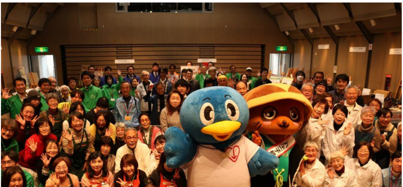
3年ぶりの対面での開催ということで、迎えるキャストの皆さん撮影の瞬間はマスクはずして晴れやかな様子です