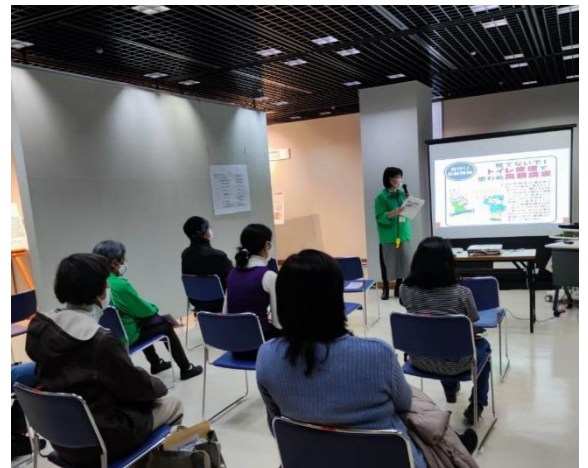
身近にひそむ悪質商法にご用心!