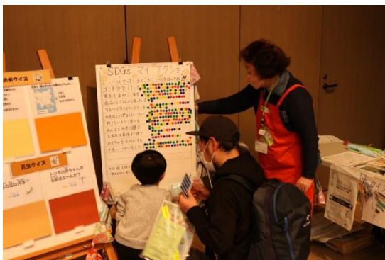
SDGsの取り組みについて親子で答えていただきました

貼り付けパネルを前に、我が家のSDGsの現状を確認しながら、〇シールで埋めていただきました。日々のアクションがどのくらいできているか、他の人と比べてどうなのか気づきの瞬間です。