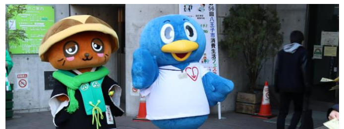
出展団体のキャラクター、左が「たき坊」右が「クルリ」キャラクターの皆さんも、1階の玄関で開催中の案内・お迎えをしました。