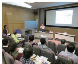
家庭の省エネ講座

地球温暖化防止活動推進員による講座を希望する場合はクールセンター八王子へお申し込みください。