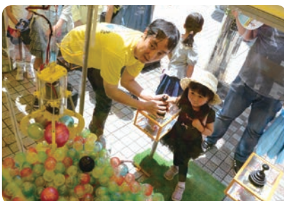
①【北口西放射線ユーロード】 ごみクレーン体験