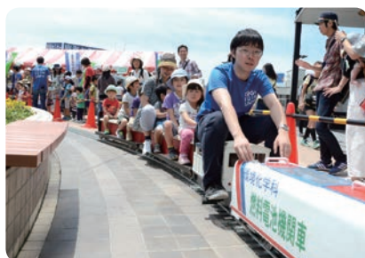
②【南口とちの木デッキ】 「燃料電池機関車」乗車体験