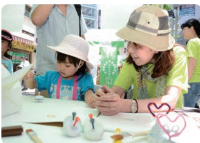
①【北口西放射線ユーロード】 クラフトワークショップ