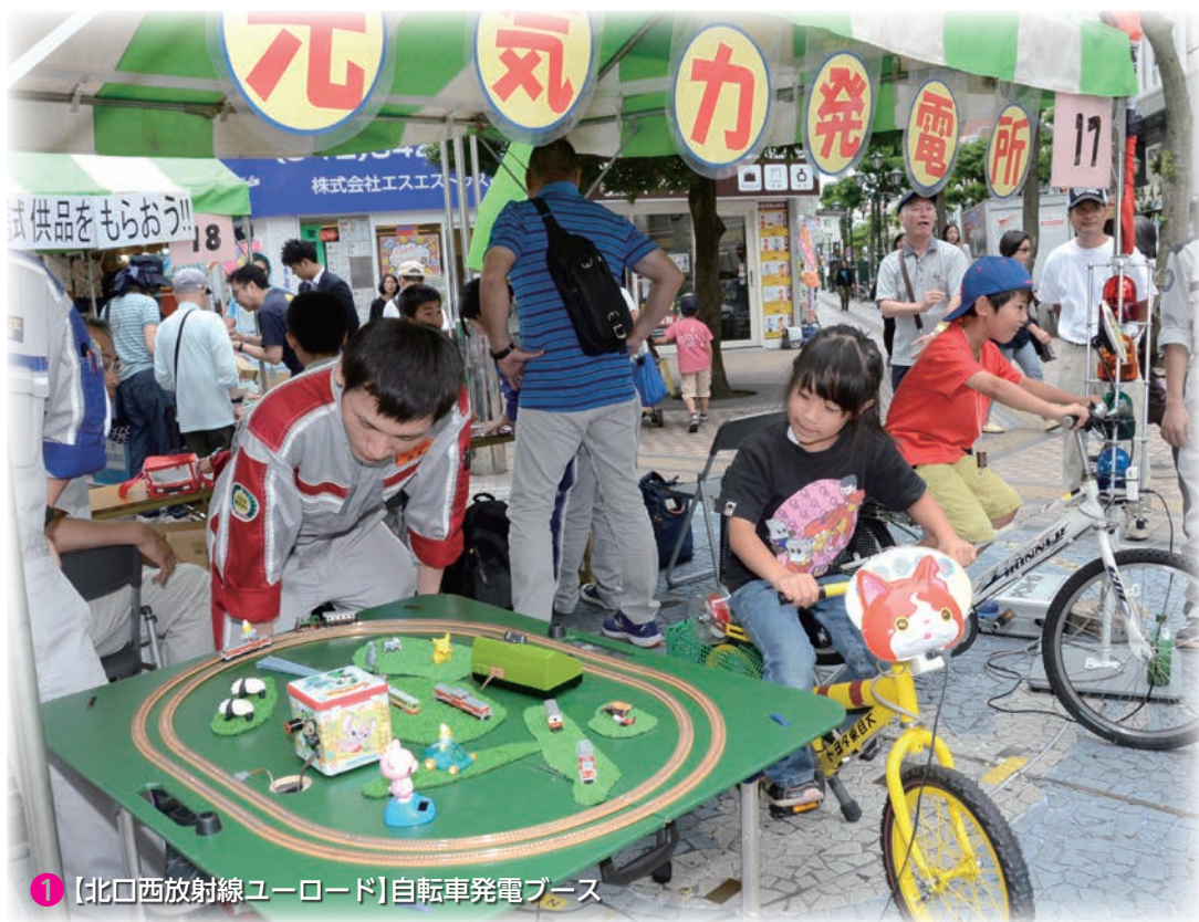
①【北口西放射線ユーロード】自転車発電ブース

「はちおうじの環境をみる・きく・考える」 毎年環境月間である6月の第一土曜日に、市民や事業者の皆さん とともに、「八王子環境フェスティバル」を開催しています。 今年も6月3日(土)に八王子駅北口西放射線ユーロードと南口 とちの木デッキにて、午前10時から午後5時まで開催します。