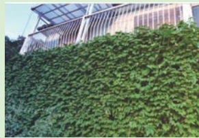
平成28年度最優秀賞 (戸建住宅部門)