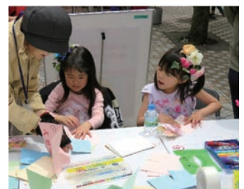
環境フェスティバル