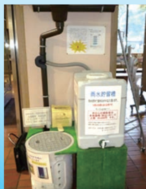
市役所1階市民ロビー等に見本を展示