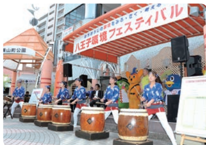
③【横山町公園】太鼓演奏