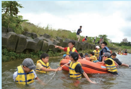
誰もが安心して遊べる川へ

下水道が整備された地域では、トイレの汚水や生活雑排水を速やかに下水道へ接続しなければなりません。しかし、平成28年度末時点で4,485件もの未接続物件があります。未接続物件からの生活排水は川