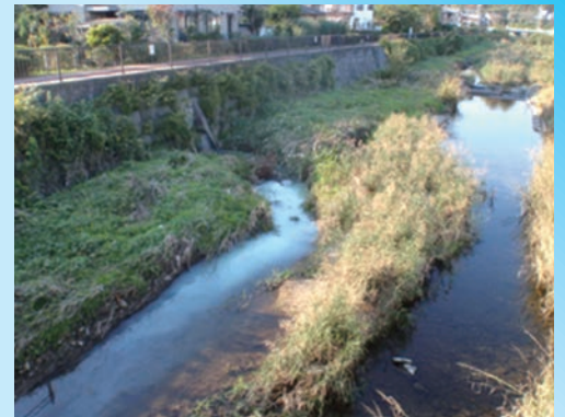
河川に流れ込む生活排水