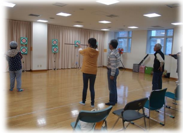
▲作品展示・来場者の体験型コーナー