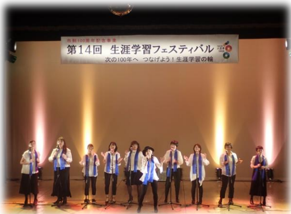
▲ステージでの発表