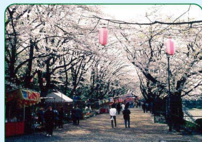
景観100選 八十八景 みどり・公園の景