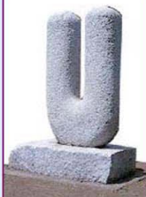
彫刻「風の標識 No.2」 ／大成造作