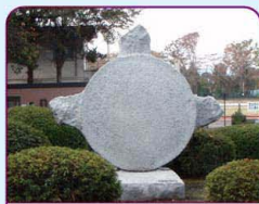
彫刻「風祭」 ／小林亮介作