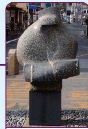
彫刻「友の顔 (逢々) I」 ／酒井良作

八十八景 まつり・行事の景 しょうがまつり 毎年9月上旬に行なわれる永福稲荷神社の例祭。