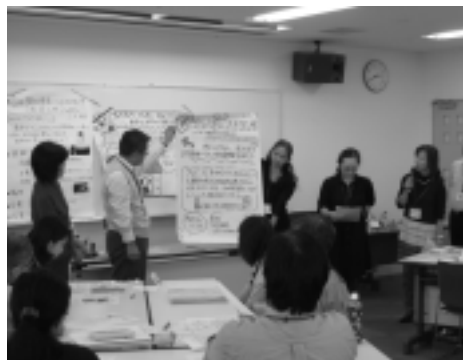
生涯学習コーディネーター養成講座

また、専門性を有するボランティアの養成やボランティア活動の支援体制を充実し、ボランティア活動への参加を呼びかけていくことが重要です。