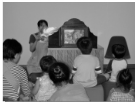
図書館でのおはなし会

そのため、数多くある生涯学習関連施設が連携を図り、市民の生涯学習活動への多角的な支援を進め、だれでもが利用しやすいものとしていく必要があります。また、図書館が持つ大きな機能を活用し、生涯にわたって読書に親しめる環境づくりと個人の読書環境をバックアップするなど、図書館サービスを充実し、「読書のまち八王子」への取り組みを推進する必要があります。