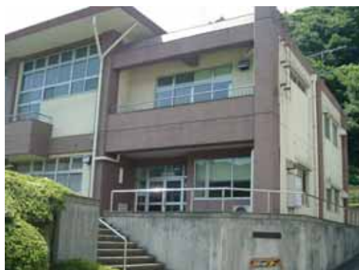
恩方農村環境改善センター