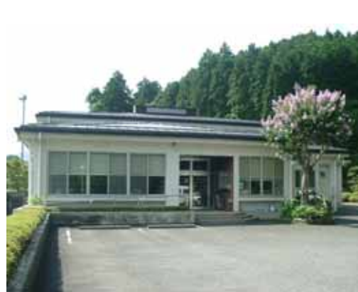
上川農村環境改善センター