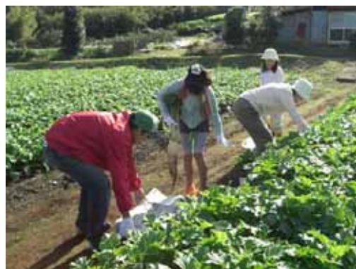
大根作り体験（小比企町）