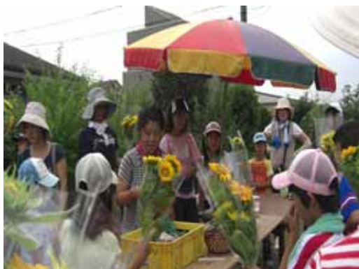
農業体験ツアー（長沼町）