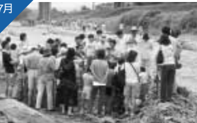
浅川の鶴巻橋上流でステゴドンソウの化石が発見され、発掘現場の見学会を開催