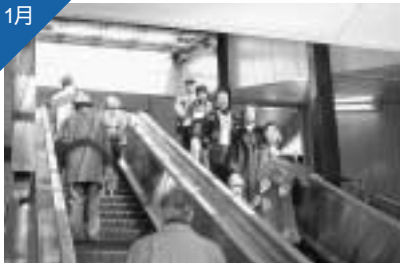
市民待望の八王子駅南口エスカレーターが稼働