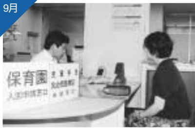
4つの事務所で業務時間を午後7時まで延長し、福祉サービスの受付も開始