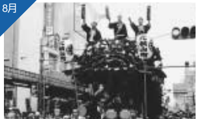
八王子まつりを夏・秋に分けて開催。8月は山車・みこしを中心に、花火大会は10月に