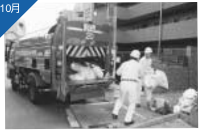
八王子駅北口周辺地域でごみの早朝収集を開始