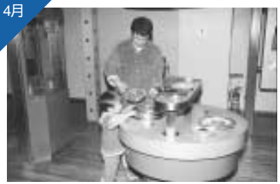
サイエンスドーム八王子やプールなどの施設の土曜日の子ども料金を無料に