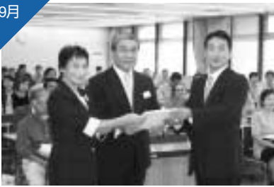
3月の中間報告に続いて「ゆめおり市民会議」が基本構想・基本計画の最終素案を提出