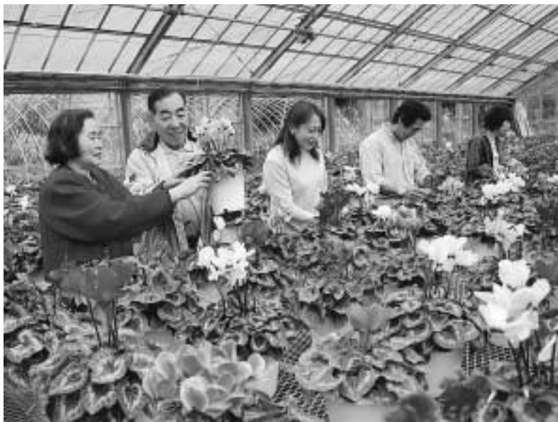
年末に向けシクラメンの販売が最盛期を迎えています(市内の花き栽培農家で)