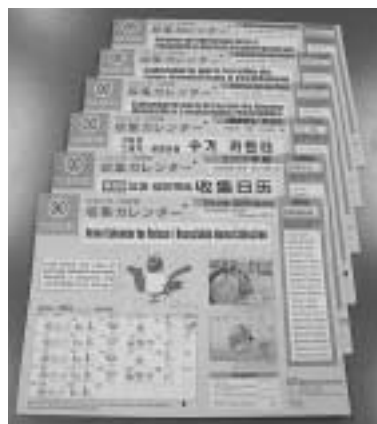
外国から来ている方にご紹介を

ごみ収集カレンダーは、英語、中国語、ハングル、スペイン語、ポルトガル語、タガログ語版も用意しています。外国人登録の際にお渡ししていますが、市役所3階ごみ減量対策課と八王子駅北口の八王子スクエアビル11階八王子国際協会ではいつでもお渡ししています。