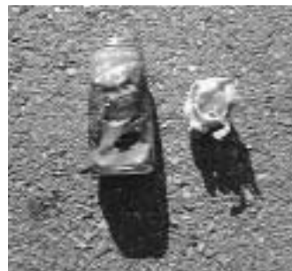
◀ 火元と思われるスプレー缶

中身のガスが残ったまま不燃ごみとして出したスプレー缶が原因と思われる収集車火災が頻発しています。幸い負傷者は出ていませんが、車両に被害は出ており人命に係わる事故にもつながりかねません。中身は必ず使いきってから出してください。