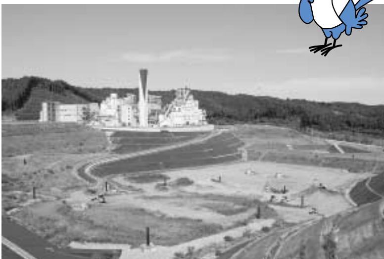
二ツ塚最終処分場とエコセメント化施設(西多摩郡日の出町)