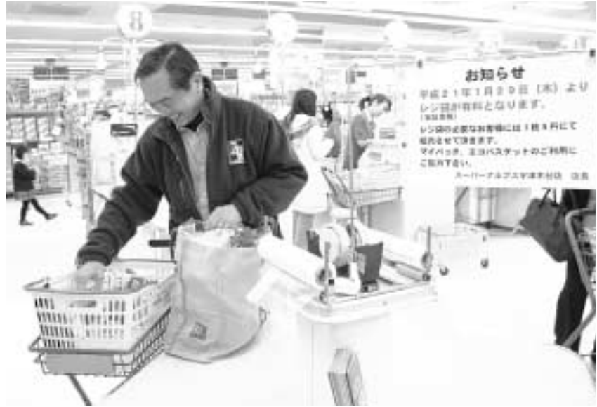
マイバッグでお買い物を

この取り組みに対し、スーパーアルプス宇津木台店周辺にお住まいの方だけでなく、市民の皆さんの応援をお願いします。