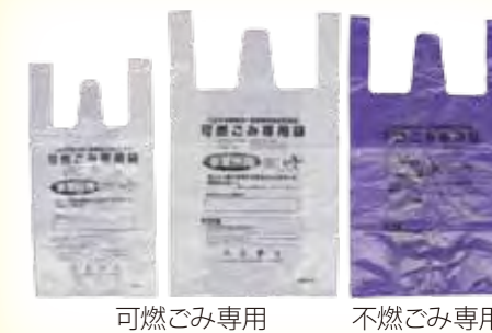
可燃ごみ専用 不燃ごみ専用