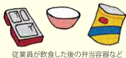
従業員が飲食した後の弁当容器など

※空のペットボトル、びん、缶はなるべく購入した販売店に返却するなどして処理してください。