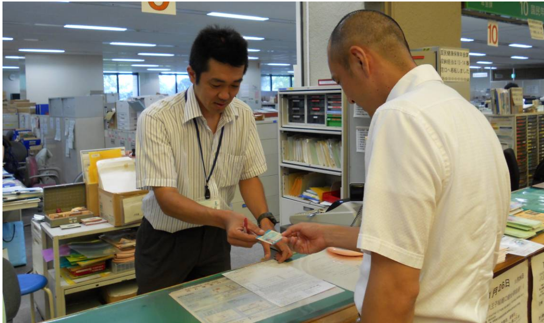
▲ The state of the alien registration ▲ 外国人登録窓口の様子

Ministry of Justice are planning to change the registration system for foreign citizens on July 2012.