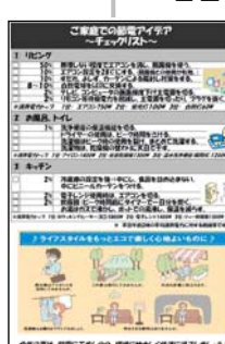
▲Hachioji city provides information on power saving in multiple languages.