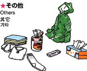
★その他 Others 其它 기타

Ropa interior, Chaquetón, Calcetines, Guantes, Pañuelos, Toallas, Papel higiénico, Casco, Encendedor, Fósforos, Sábana de vinilo, Capa de lluvia, Artículos sanitarios y Pañales desechables 下着、上着、靴下、手袋、ハンカチ、タオル、ティッシュペーパー、ヘルメット、ライター、マッチ、ビニールシート、雨具、生理用品、紙おむつ