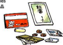
★貴重品 Valuables 貴重物品 귀중품

Dinero en efectivo, Libretas de banco, Impresión de sellos, Pasaportes, Tarjetas de registro, Certificados y Carnet del seguro de salud 現金、通帳、印鑑、パスポート、外国人登録証、証書類、健康保険証