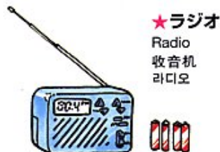
★ラジオ Radio 收音机 라디오

Tafetán inglés, Gasa, Venda, Venda triangular, Desinfectante, Calmante, Medicina de resfriado, Antifebrina, Remedio gastrointestinal y otros Remedios Caseros ばんそうこう、ガーゼ、包帯、三角巾、消毒薬、鎮痛剤、風邪薬、解熱剤、胃腸薬、その他常備薬