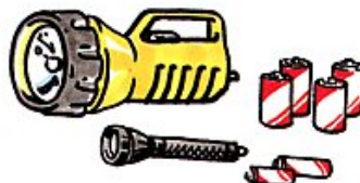
★懐中電灯 Flashlight 手电筒/회중전등

Linterna y baterías de recambio 懐中電灯と予備の電池