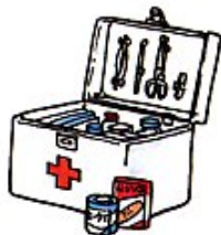
★救急薬品 First aid kit 急救薬品 구급약품

Tafetán inglés, Gasa, Venda, Venda triangular, Desinfectante, Calmante, Medicina de resfriado, Antifebrina, Remedio gastrointestinal y otros Remedios Caseros ばんそうこう、ガーゼ、包帯、三角巾、消毒薬、鎮痛剤、風邪薬、解熱剤、胃腸薬、その他常備薬