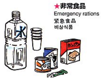
★非常食品 Emergency rations 緊急食品 非常食品

Pan deshidratado y galletas, Conservas, Lamen(fideo) instantáneo, Agua potable, Copay Plato de papel, Palillo disponibles, Navaja Y Cuchillo, Abridor de latas, Sacacorchos クラッカー、缶詰、インスタントラーメン、飲料水 紙皿、紙コップ、割り箸、ナイフ、缶きり、栓抜