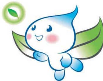
(郡のキャラクター)

郡の鳥—カササギ：勤勉で親近感と安定感のある、郡民の気質を象徴しています。 郡の花—モクレン：自助・自立・共同の象徴で、未来志向の郡民像を表しています。 郡の木—ケヤキ：飾り気がなく、温和で純朴な郡民の気質を象徴しています。