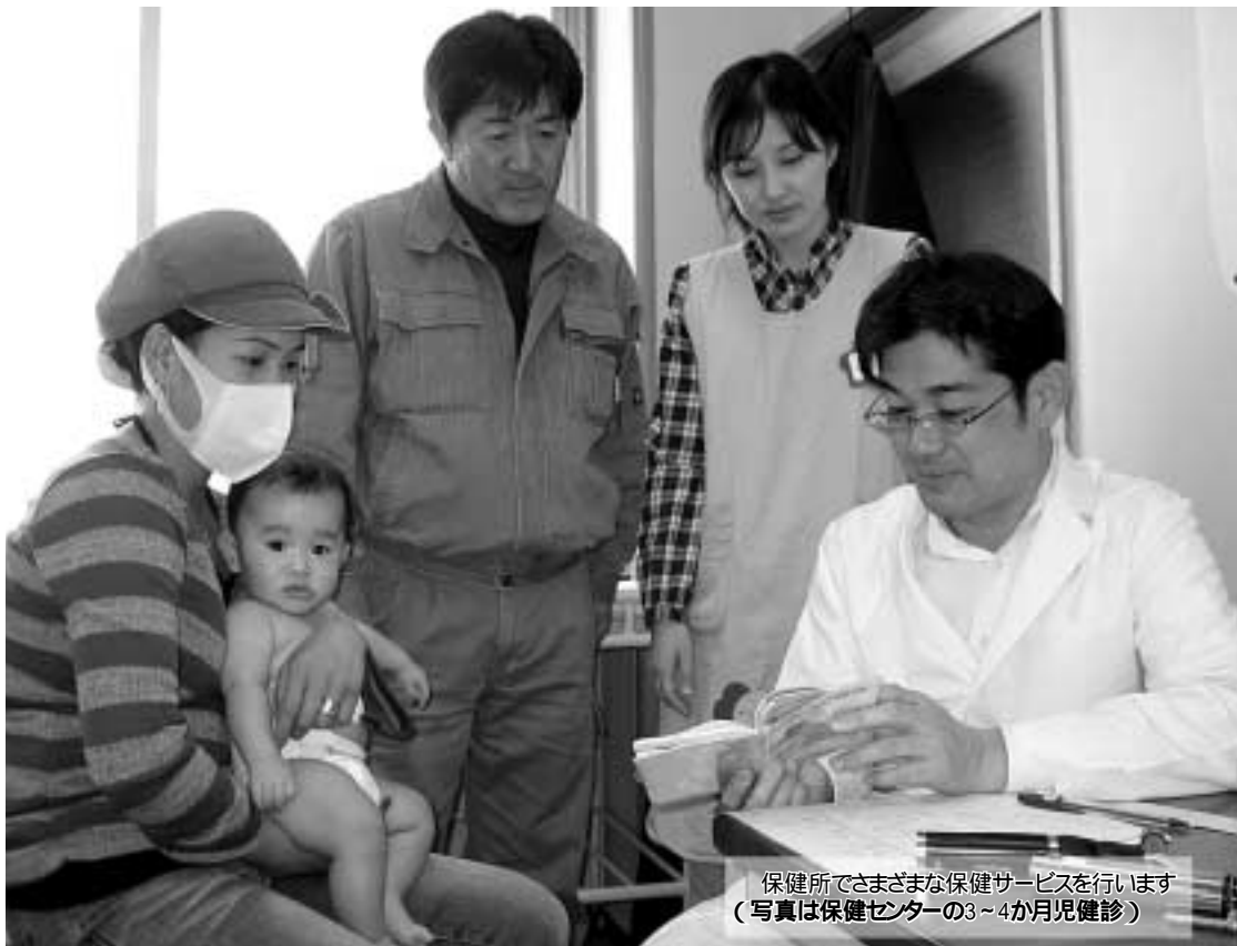
保健所でさまざまな保健サービスを行います (写真は保健センターの3~4か月児健診)