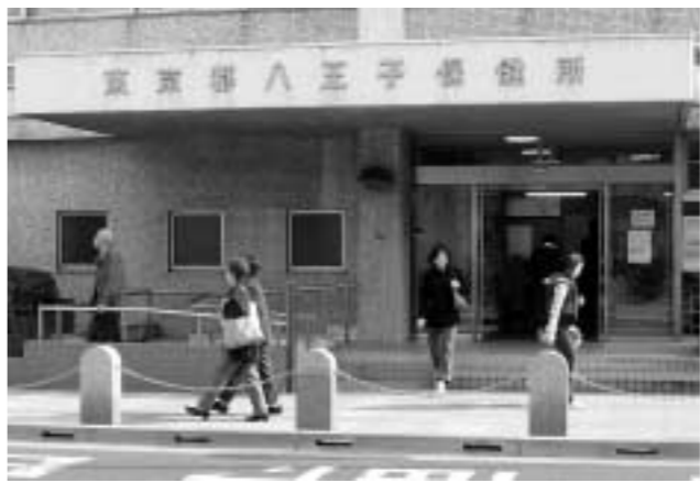
東京都八王子保健所が「八王子市保健所」にかわります

保健所の施設 これまでの東京都八王子保健所の施設を使用して業務を行います。これにより、市民に身近な保健衛生サービスを、利便性の高い場所で提供することが可能になります。