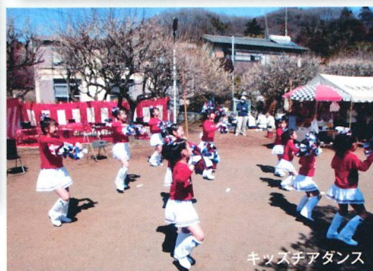
キッズチアダンス