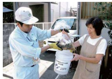
▲生ごみを回収する様子

平成23年9月から11月までで生ごみ資源化等モデル事業を4団体137世帯(9月現在)で実施しています。これは、分別していただいた生ごみを週1回モデル的に市が回収する事業です。回収した生ごみは、たい肥化工場でリサイクルしています。