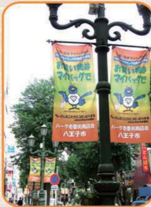
▲商店会のフラッグ。まちのあちこちから呼びかけます。

八王子市では、10月を「マイバッグ利用促進月間」、10月5日を「マイバッグの日」として、マイバッグの利用を呼びかけています。