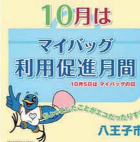
▲今年のポスター。八王子市認定エコショップを中心に掲示します。