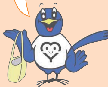
リサイクルマスコット「クルリ」

お客さまへの声かけや「レジ袋不要カード」の設置、そのほかマイバッグを利用していただくために様々な取組を行っています。