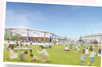
都内唯一の「日本遺産」を通じてまちの魅力を発信

公園・ライブラリ・交流スペース・ミュージアムが一体となった複合機能施設「八王子駅南口集いの拠点」。令和8年度のオープンに向け、市民ワークショップなどを開催するとともに施設の建設工事を進めています。