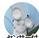
センサー付ライト