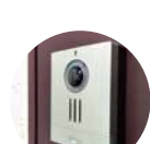
カメラ付インターホン