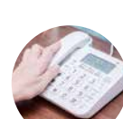
迷惑電話防止機能付き電話機