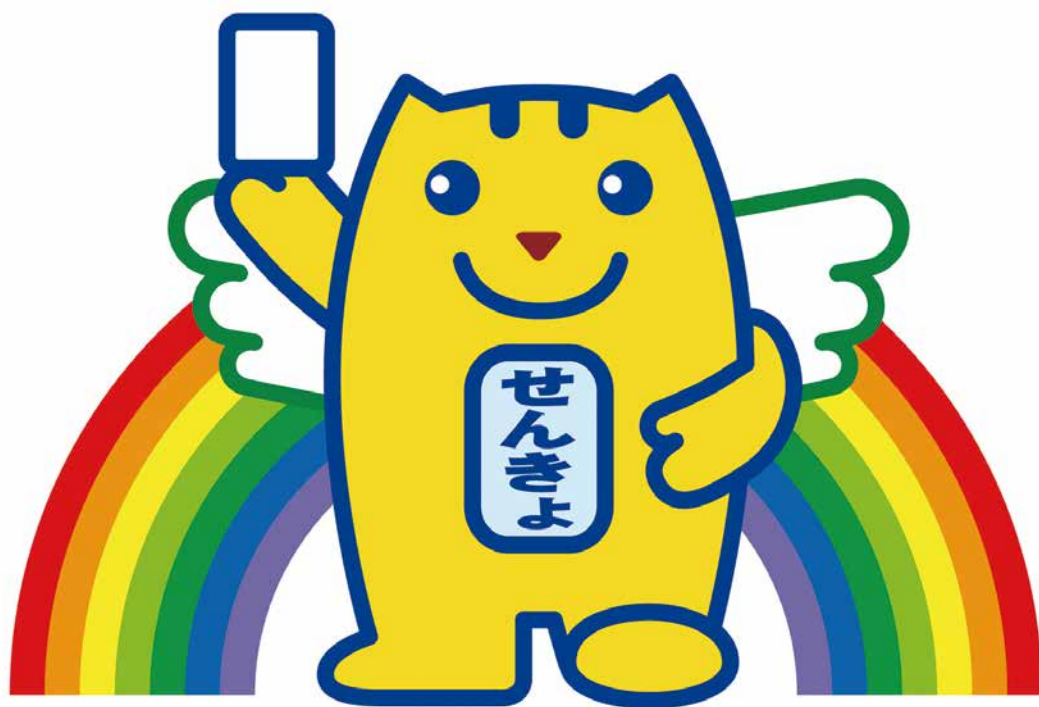
明るい選挙キャラクター「選挙のめいすいくん」