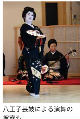
八王子芸妓による演舞の披露も

■花街日本酒呑み歩き 専用おちよこを500円で購入し、桑都テラスや周辺の日本酒醸造所、飲食店でイベント用メニュー(各千円)をお楽しみいただけます。3店舗回ると抽選会に参加できます。 日時 11月25日(土)正午～午後5時