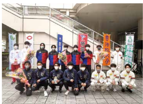
総合優勝をめざして(写真は昨年のような)

事前申込が必要ですが、詳しくは戸吹スポーツ公園(691・2288)までお問い合わせください。 対 小学生と保護者(2人1組) 日 1月5日(金) コース 初心者:午前8時30分~9時30分 経験者:午前9時40分~10時40分 会 戸吹スポーツ公園 定 各8組(先着順) 費 千円