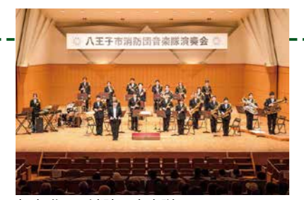
市内唯一の消防団音楽隊

対高校生、またはおおむね30歳以下で求職中の方 内容 プログラミングによるコンペアの自動運転 日 12月2日(出)午前9時45分〜正午 会 同校(台町一丁目) 定 10名(先着順) 問 産業振興推進課(☎620・7252)